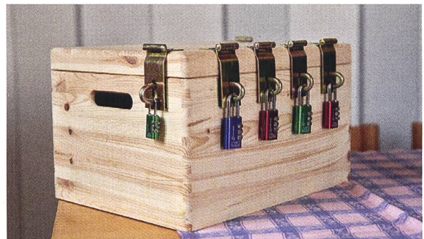
Schatztruhe mit den sechs zu knackenden Zahlenschlössern.