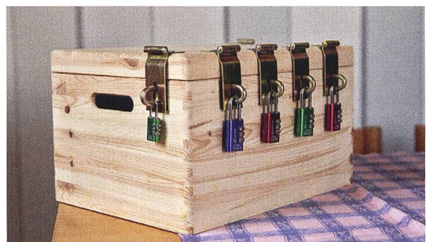
Schatztruhe mit den sechs zu knackenden Zahlenschlössern.