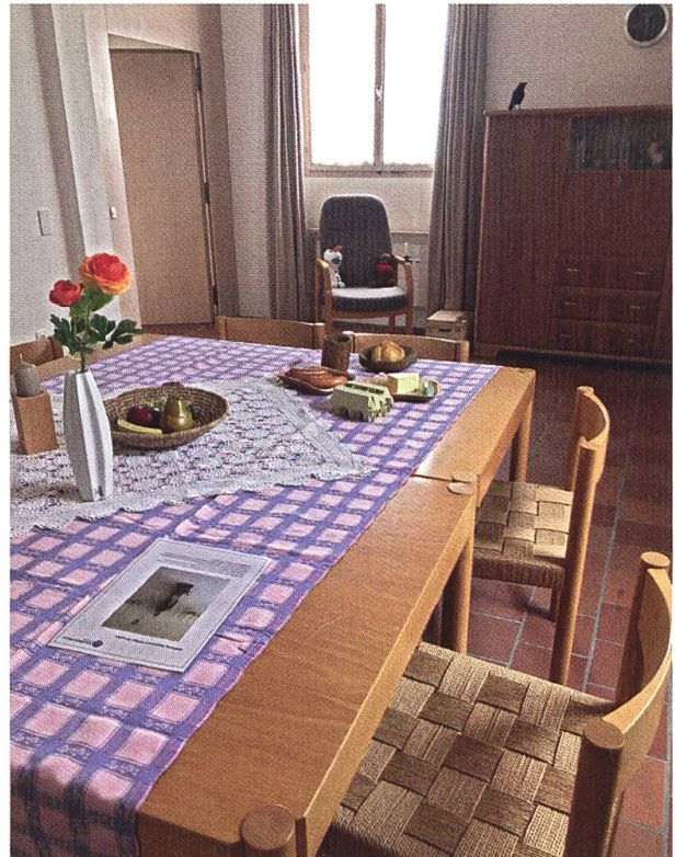
Blick in den Escape Room.

Kontakt wallfahrt@kloster-mariastein.ch oder Tel. +41 (0)61 735 11 11