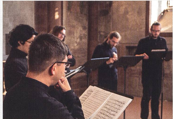
The Society of Voices.

Zitate anspielen. Diese Verzweiflungsschreie und Klagerufe, diese Bitten nach Erbarmen und Rettung, vertonte Byrd in einer in der englischen Musik bisher ungehörten Art und Weise. Seine Motetten müssen ausserordentlich bewegend und eindringlich auf ihre ersten Zuhörer gewirkt haben und haben gerade in der gegenwärtigen Situation nichts von ihrer emotionalen Intensität verloren.