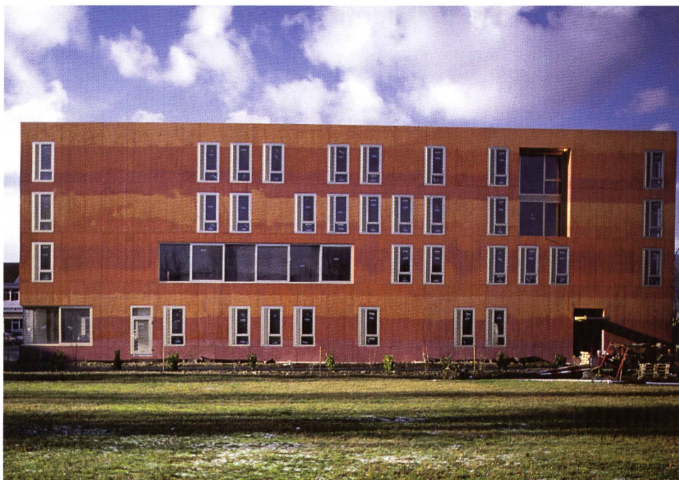
Centre psychiatrique du Nord Vaudois, Yverdon, façade est.

littéraire qui déchiffrent bon an mal an des dizaines de milliers de manuscrits qu'ils sélectionnent selon leur goûts, selon ce qui est convenu, selon leurs compétences. Seront ainsi édités et produits les livraisons de l'année pour les besoins du marché. Une autre critique alors s'en saisit (parfois la même) pour dire la messe des grands prix littéraires.