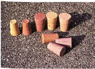
Béton pigmenté, échantillons.

Comment vous dire, en première instance, que la critique est inutile?