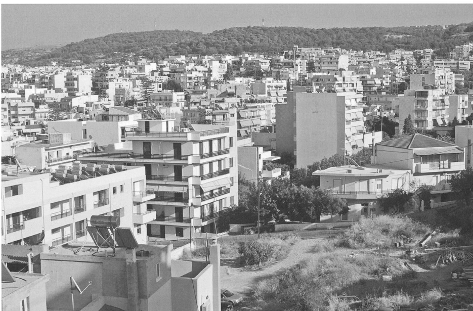
Panorama de Rethymno, les polykatoikies dépassent les limites de la ville dans un tissu urbain ondulé.

L'analyse typologique permet de réfuter l'idée courante selon laquelle l'application systématique d'une ossature ponctuelle en béton dans l'édification des polykatoikies est dans la lignée du système Dom-ino corbuséen. En établissant une comparaison sys-