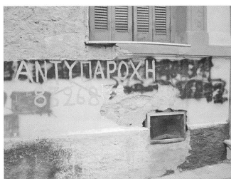
Le mot «Antiparochi» mal orthographié sur le mur d'un vieux bâtiment dans le quartier Kolonos d'Athènes (à gauche).

La perception dominante de la polykatoikia de Rethymno se base sur la nostalgie d'une vie passée et sur le mode de vie rurale (à droite).