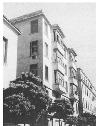
Les polykatoikies Pasmazoglou (1900) de Ernst Ziller en haut et Logothetopoulou (1931) de Kyprianos Biris en bas.