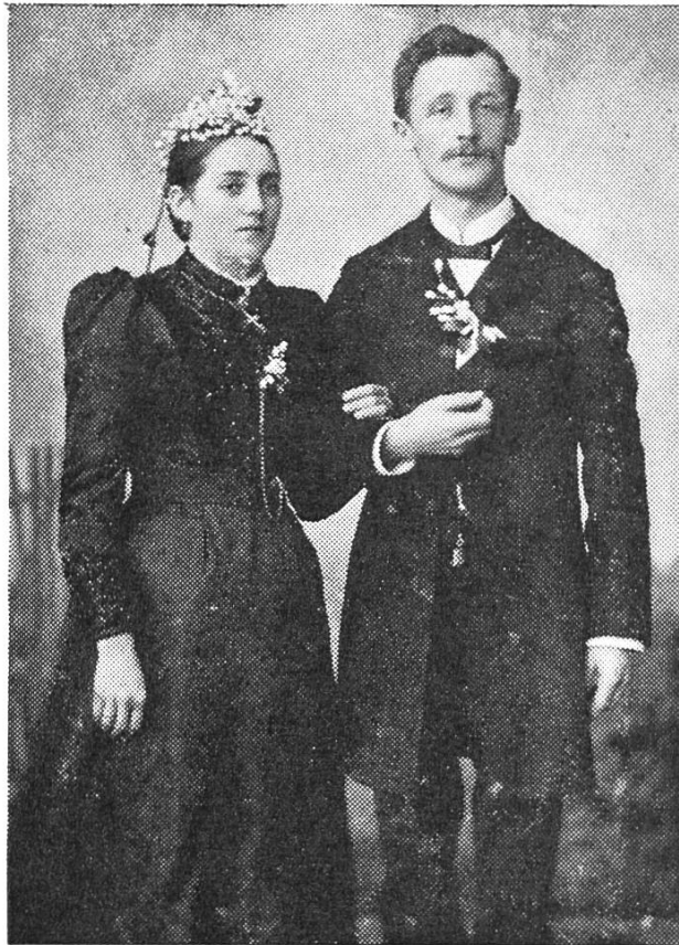
Das Hochzeitspaar Spiess in zeitgemässer Kleidung.

in die Rechnungsprüfungs-Kommission der Kantonalbank gewählt, 1916 rückte er zum Bankrat vor. Ausserdem war er in einer Reihe anderer kantonsrätlicher Kommissionen tätig. Als Mitglied der Seminardirektion kam er mit den jungen Lehramtskandidaten wieder in nähere Fühlung, dann war er Präsident der Staatswirtschaftskommission und wurde 1921 Vizepräsident und 1922 Präsident des Kantonsrates.