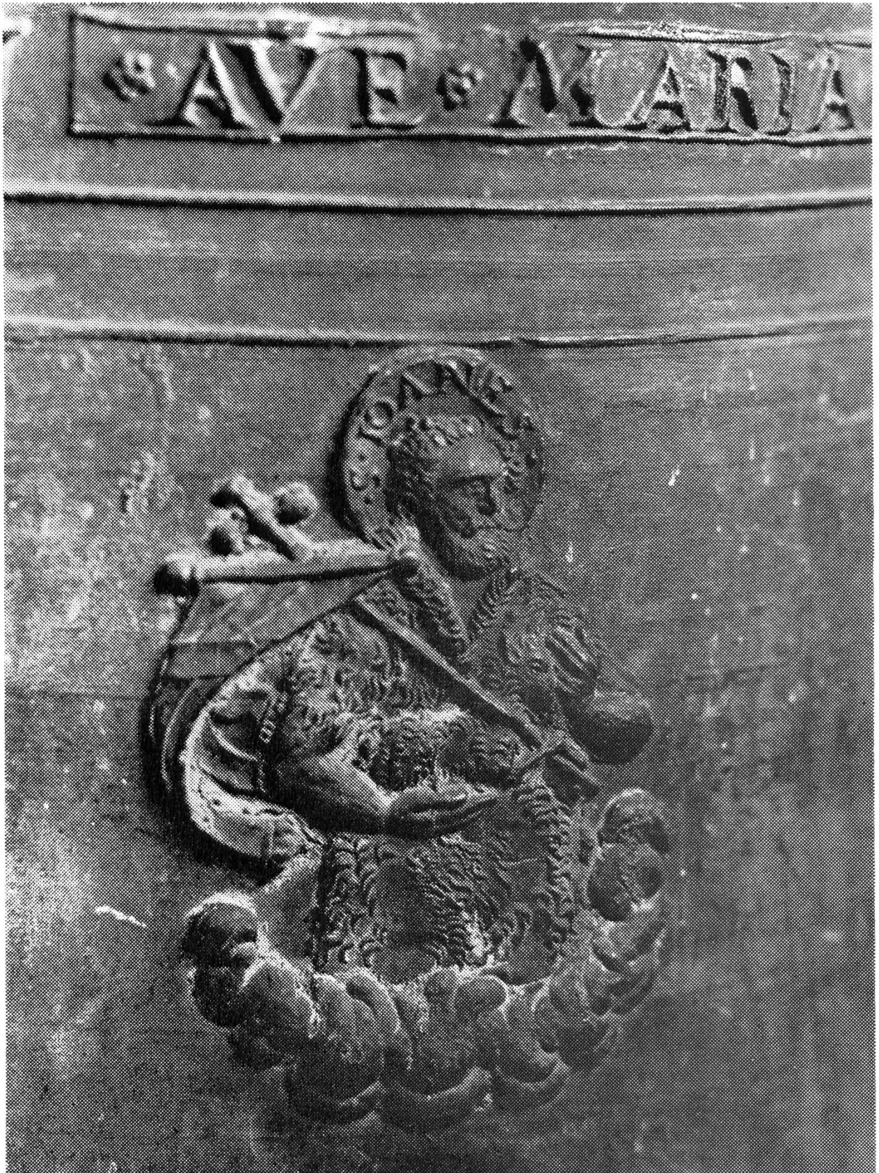
Bildbeschreibung siehe Seite 16.