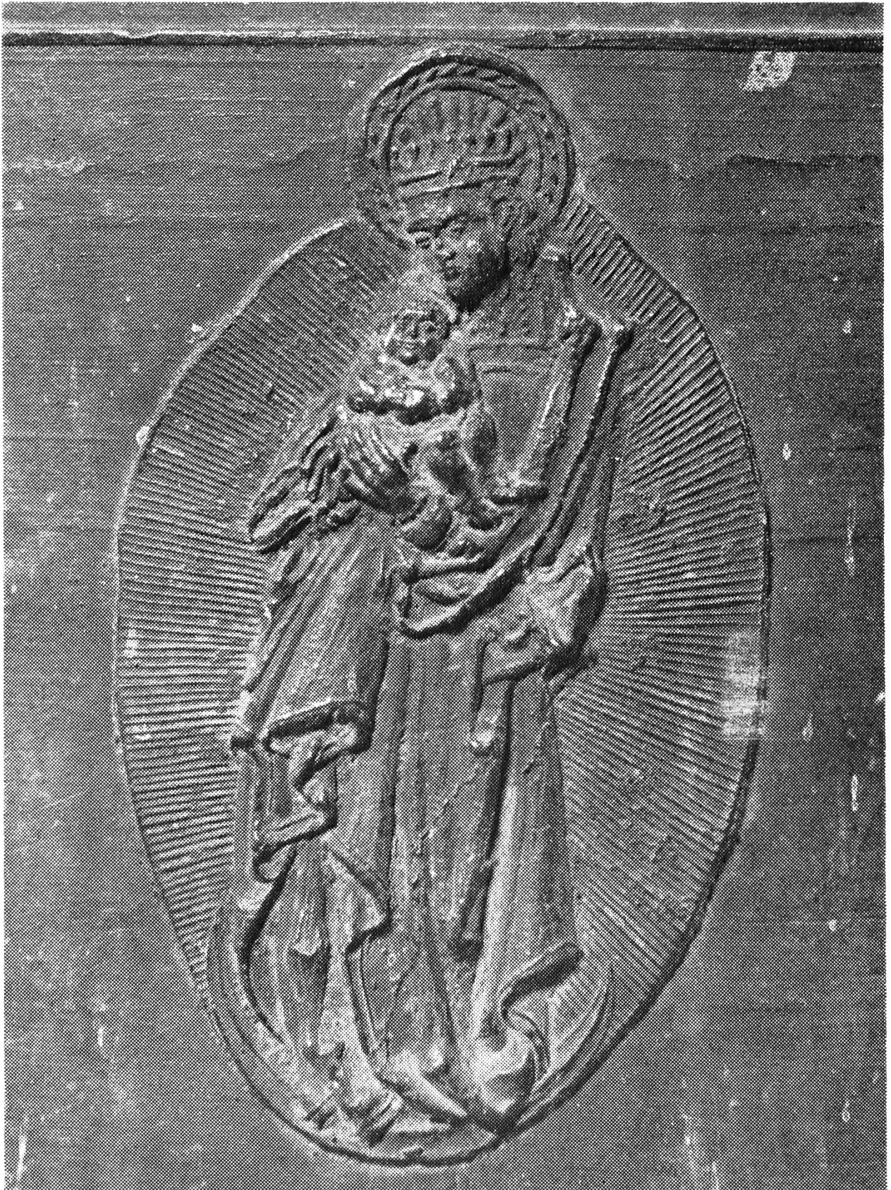
Bildbeschreibung siehe Seite 16.