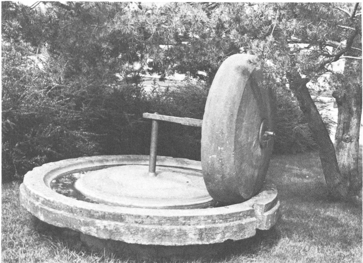
1 Bett und Mühlrad der alten Ziegerkrautmühle («Rybi»), Standort: Neuheimstrasse 22