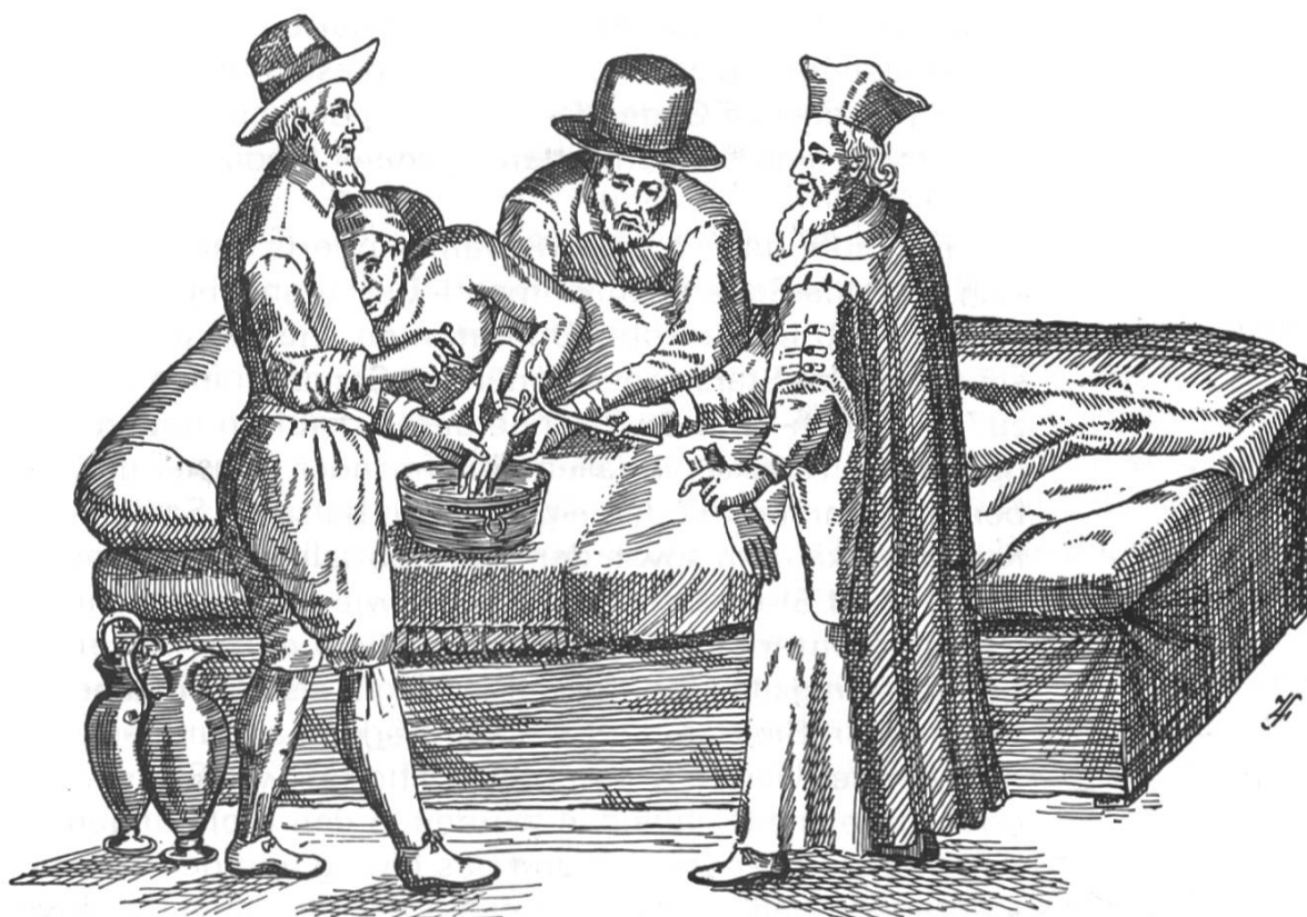
Aderlassen an der Hand, Bildarchiv des Medizinhistorischen Instituts der Universität Zürich.

Blieben die Bader bei ihrer angestammten Arbeit und verrichteten darüberhinausgehende Eingriffe nie in nennenswertem Masse, so versuchten die Scherer immer intensiver und erfolgreicher, möglichst viele Tätigkeiten der Wundbehandlung und Chirurgie zu ihrer Aufgabe zu machen. Sie behandelten die unterschiedlichsten Erkrankungen, welche durch äusserliche Verletzungen entstanden sind; der innere Bereich – der Bauch und die Brusthöhle – blieb ihnen grundsätzlich verwehrt. Gefördert wurden diese Ausdehnungsbestrebungen dadurch, dass die Ärzte die Chirurgie