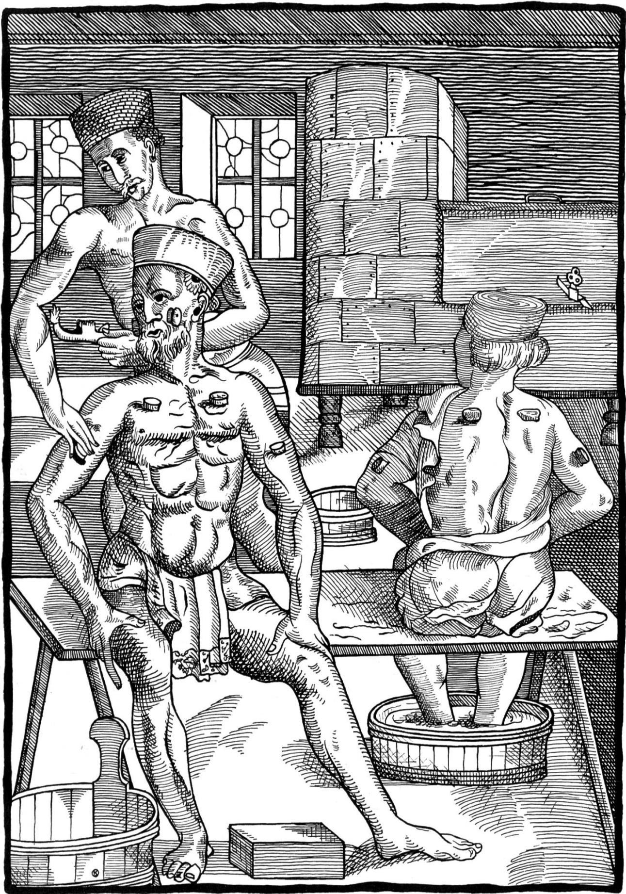
Bader beim Aufsetzen von Schröpfköpfen, Bildarchiv des Medizinhistorischen Instituts der Universität Zürich.