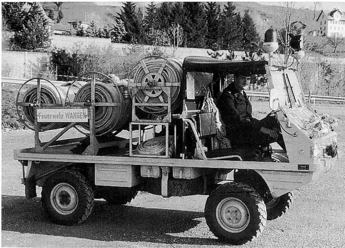
Haflinger Schlauchwagen, ab 1966.