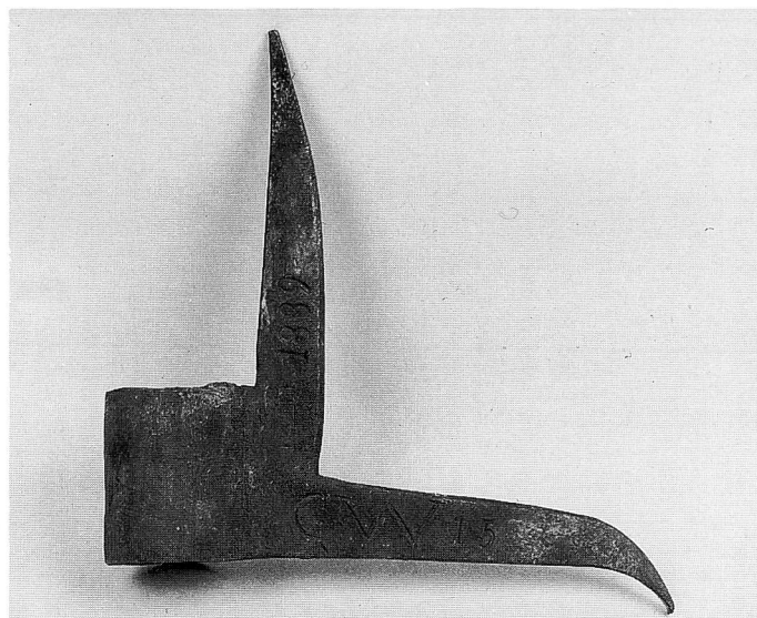
Feuerhaken zum Abstützen oder Rausreissen, an ca. 8 m langem Stiel.

serveflaschen und ohne die Ausbildung der zugeteilten Personen) – die wesentlichen Kostenpunkte ausmachen. Hinzu kamen Posten wie die Ausstattung der Notstromgruppe mit Scheinwerfern und diversem weiteren Zubehör, Umbau bei Schläuchen und Hydranten auf Storzkupplung, Neubemalung der Hydranten, Schlauchwaschanlage, Mehrkosten Generalfeuerschau, Kleidung, Soldanpassung (anno 1966 handelte es sich um die Aufrechnung von Franken 2.50 auf 3.– Franken) und beim Kauf von grösseren Gerätschaften nicht zu vergessen, Miete, Kauf oder Bau von neuen Lokalitäten (unbestimmter Betrag).