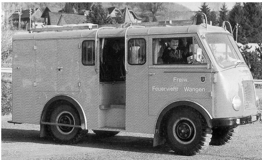
Pikettfahrzeug MOWAG, ab 1986.

Der Bezug neuer Räumlichkeiten im Mehrzweckgebäude der Gemeinde Wangen brachte hinsichtlich der