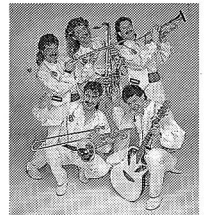
Die Fidelen Steirer