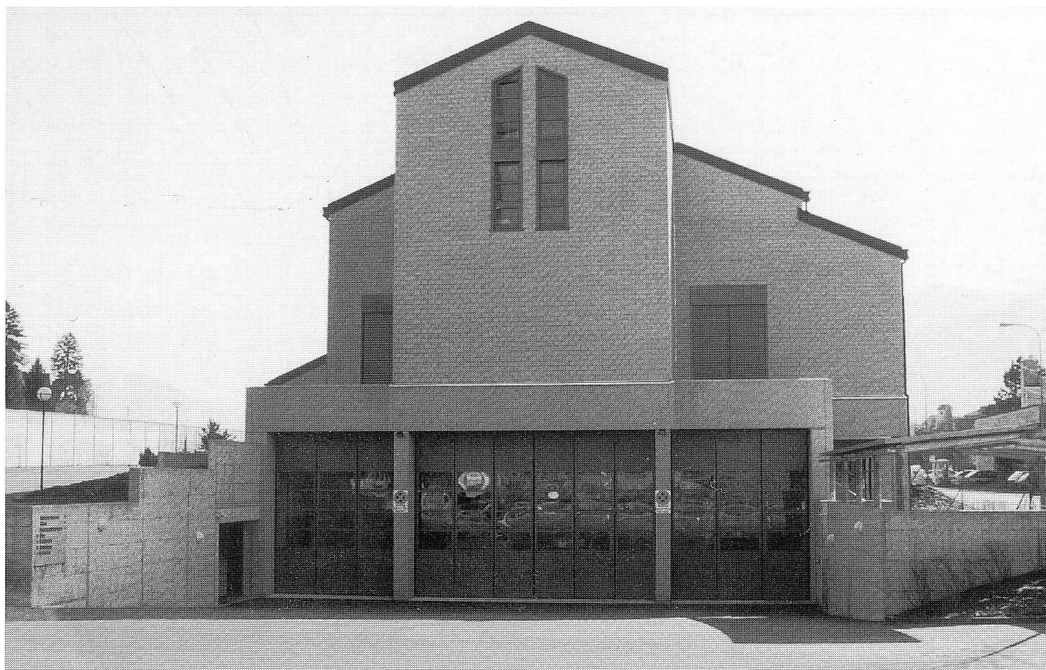
Neues Feuerwehrlokal, Einweihung am 29. März 1992.

Und noch einen weiteren Höhepunkt der Feuerwehr Wangen. Zwischen Weihnachten und Neujahr durften wir das lang ersehnte neue Feuerwehrlokal beziehen. Somit ist, ausser dem Löschposten Siebnen, sämtliches Material in einem Lokal untergebracht.»