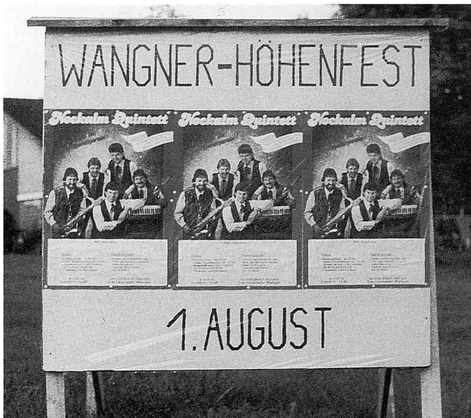
Erster von der Feuerwehr organisierter Festzeltanlass, 1. August 1991.