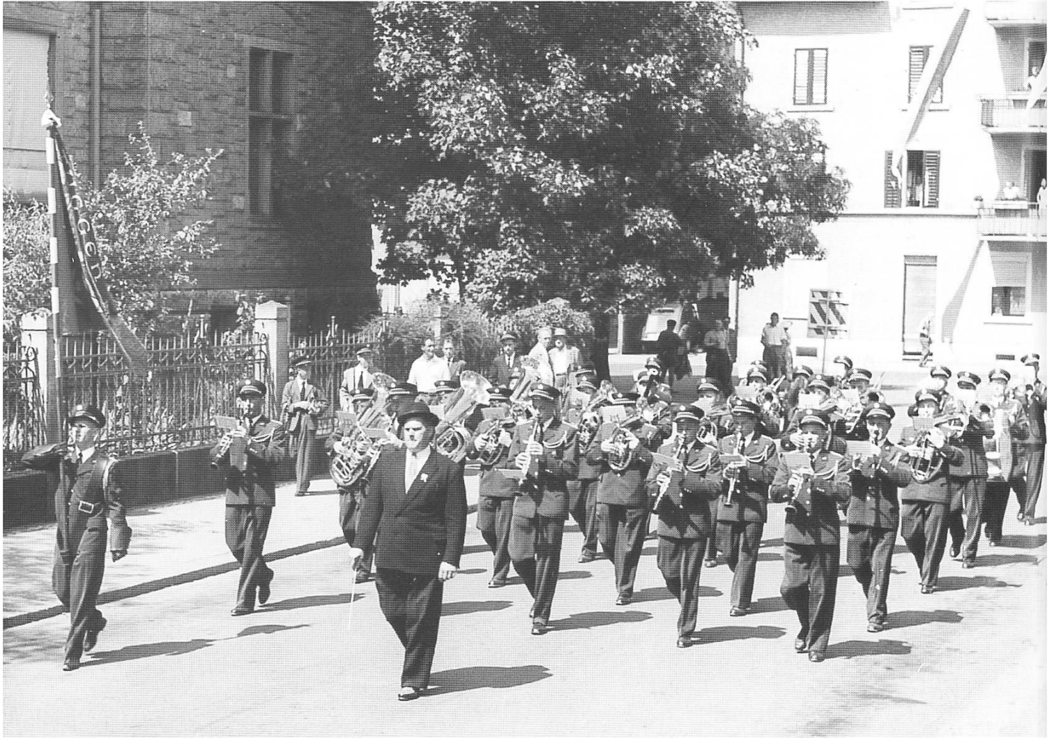
Abb. 28, Eidgenössisches Musikfest 1957 in Zürich. Die Bürgermusik Tuggen beim Wettbewerb der Marschmusik.