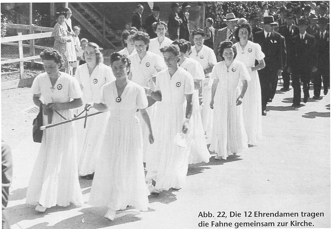
Abb. 22, Die 12 Ehrendamen tragen die Fahne gemeinsam zur Kirche.