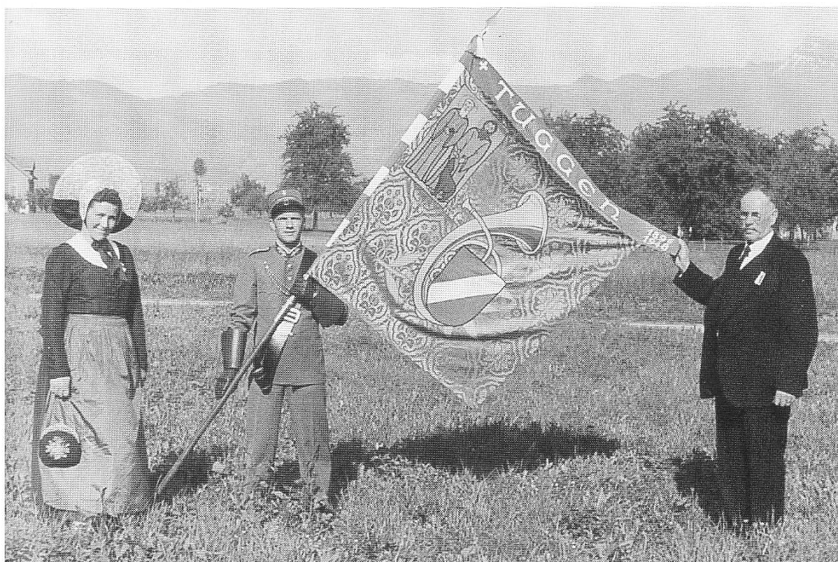
Abb. 25, Die erste Fahne mit Fähnrich und Fahnenpaten. Man beachte das damals heraldisch neu geschaffene Tuggnerwappen mit dem weissen Schrägbalken in rotem Grund.