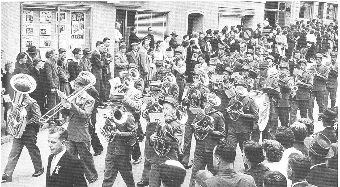
Abb. 26, Stolz marschiert und musiziert die Bürgermusik Tuggen am Kantonal-schwyzerischen Musikfest 1953 in Arth.