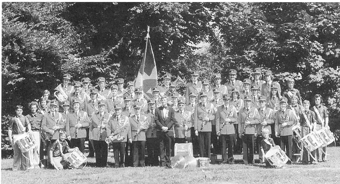
An den Musiktagen 1976 konnte die Harmoniemusik Lachen ihre neue, erstmals in Rot gehaltene Uniform zeigen. Diese musste wiederum 20 Jahre durchhalten. Aufnahme August 1977.