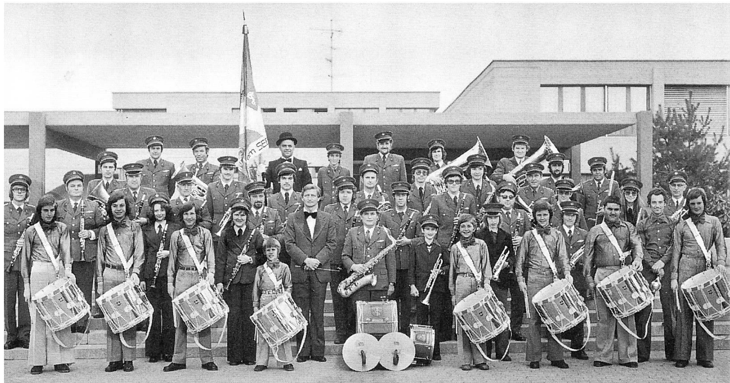
Von 1950 bis 1976 trugen die Lachner Musikanten diese swissairblaue Uniform. Aufnahme am Kapellfest 1976, drei Monate bevor diese Uniform ausgedient hatte.

kanten waren beim Festspiel «Die goldig Melodie» engagiert, und die Harmonie hatte an den eigentlichen Festtagen – 24./25. Juni 1950 – als Festmusik zu wirken. Immerhin nahmen am Kantonal-Sängerfest 88 Vereine mit 3600 Sängerinnen und Sängern teil. Unsere Musikanten hatten daher kaum Zeit, noch eine eigene Festlichkeit vorzubereiten. Aber an den Tagen des grossen Kantonal-Sängerfestes wollte man in der neuen Uniform erscheinen.