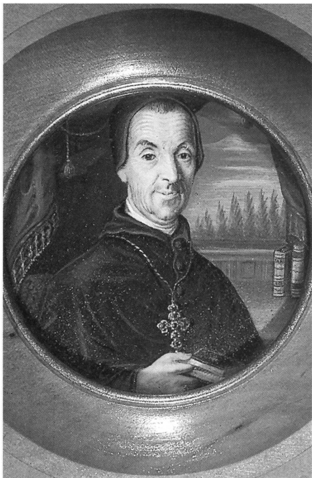
Abt Beat Küttel von Einsiedeln (1780–1808). Unter ihm trennte sich Reichenburg 1798 erstmals von der Abtei.

fangen und öffentlich hinterfragt. Dies alles machte die Abtei den Revolutionären suspekt, sodass sie schliesslich um ihre Existenz bangen musste und die Konventualen ihr Heil in der Flucht suchten.