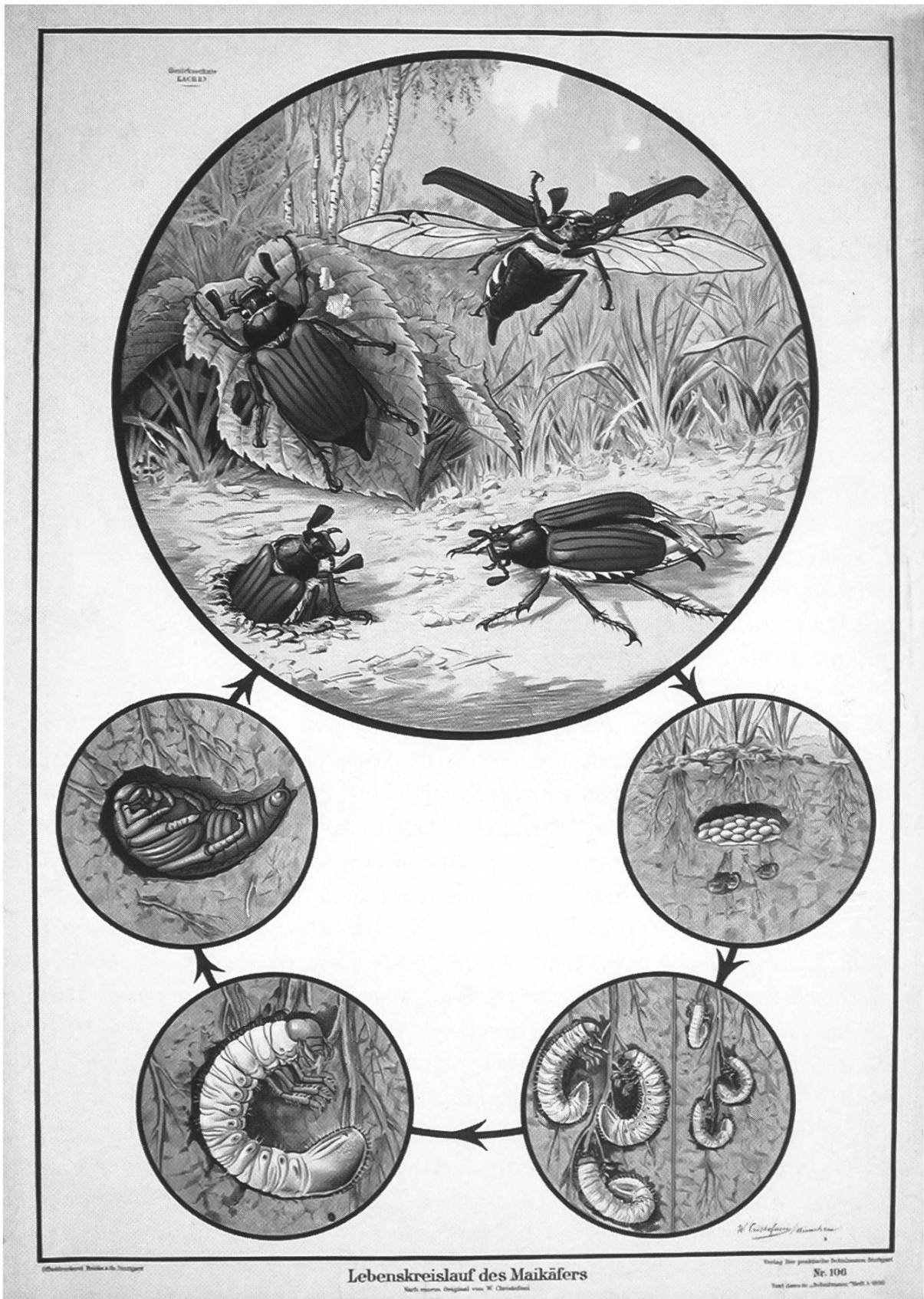
Die Schulwandbilder waren bis in die 70er-Jahre des 20. Jahrhunderts eine wertvolle Unterstützung für den Unterricht. Das Bild «Lebenslauf des Maikäfers» ist um 1930 gedruckt worden.