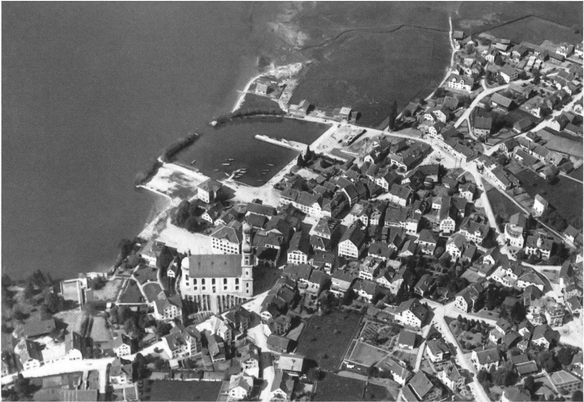
Luftbild von Lachen vor 1920. Da wo heute das Schulhaus am Park steht, war noch sumpfiges Gelände.

Der starke Anstieg der Schülerzahl – in den 105 Jahren seit der Gründung der Bezirksschule hatte sich diese vervierfacht – machten diesen Neubau notwendig. Nebst der attraktiven Lage direkt an den Ufern des Zürichsees bestach der Neubau durch eine moderne Architektur und grosszügige Unterrichtsräume. Erstmals verfügte nun die Sekundarschule über ein spezielles Naturlehrzimmer, eine Werkstatt, einen Singsaal und eine moderne Küche. Das neue Sekundarschulhaus befand sich von Beginn weg im Besitz der Gemeinde Lachen. Der Bezirk March steuerte allerdings 55% der Erstellungskosten bei. In einem zwischen der Gemeinde Lachen und dem Bezirk March geschlossenen Vertrag wurden die Nutzungsverhältnisse festgehalten. An anderer Stelle wird noch von diesem speziellen Vertrag die Rede sein. Der Sekundarschule (und den in den 60er-Jahren eingeführten Abschlussklassen – heute Realschule) genügten anfänglich die Räume des nördlichen Hauptbaues. Im Südtrakt waren Primarklassen einquartiert.