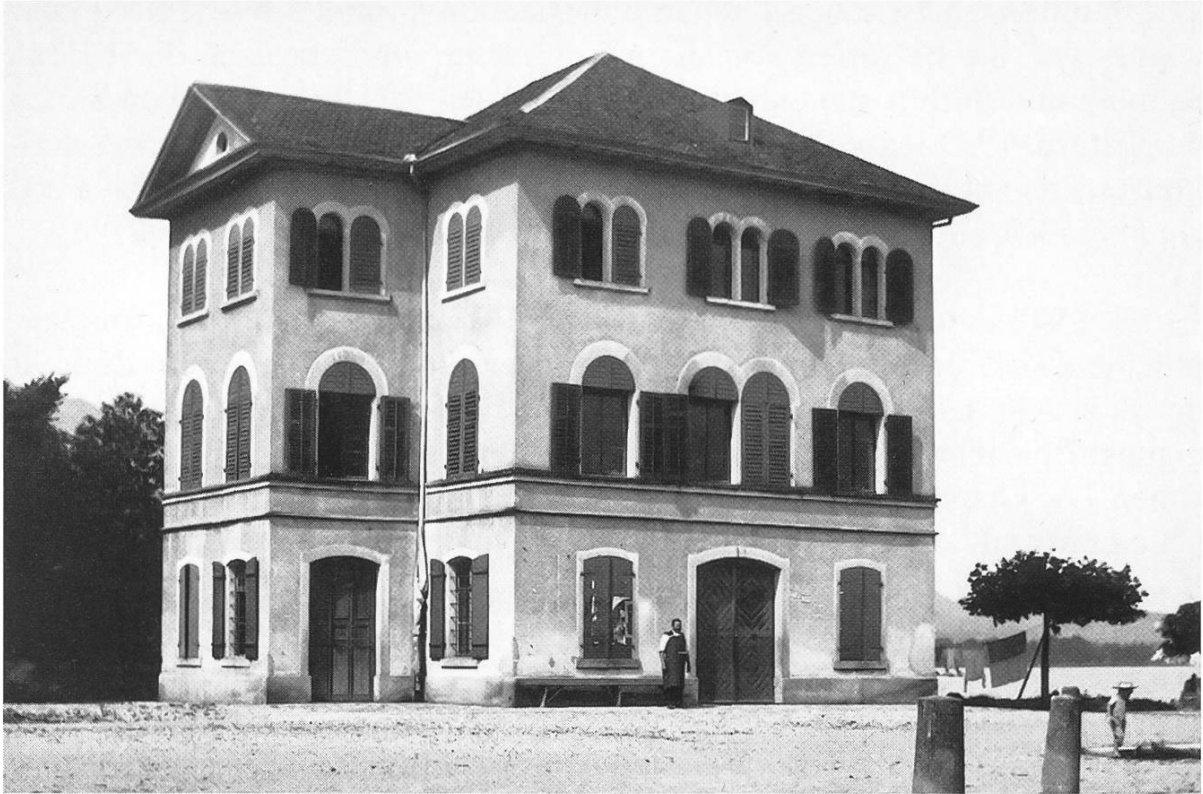
Im Alten Zeughaus (hier um 1900) wurden 1928 im ersten Stock zwei Schulzimmer für die Sekundarschule eingerichtet.

7. Mai 1910 wurde von der Antwort der Gemeinde Lachen Kenntnis genommen. Die Gemeinde Lachen habe die «Schulumbaute in Angriff genommen...» In Traktandum 6 steht wörtlich: «Hegner (Bezirksrat) kann nur wünschen, dass die Gemeinde Lachen einmal ihren vertraglichen Verpflichtungen offen Ernstes nachkomme...»