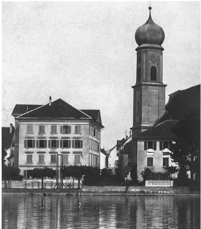
Das Alte Schulhaus neben der Kirche, ca. 1935. Auf dem Platz stehen noch die Turngeräte für die Schüler.

In dieses Schulhaus kamen 1853 auch die ersten beiden Klassen der neu gegründeten Knaben-Sekundarschule. 1898 teilte der Gemeinderat Lachen mit, dass er «gezwungen sei, eine Lehrerwohnung zu Schulzimmern umzuwandeln und wünscht von der in Ziff. 6 des Vertrages vom 1. Okt. 1852» entbunden zu werden. Er offerierte dafür eine alljährliche Wohnungsentschädigung von 250 Franken.