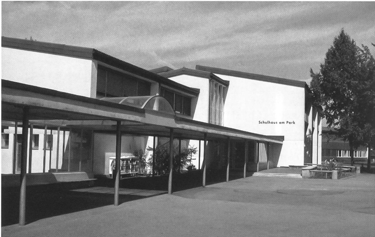
Das heutige Schulhaus am Park, 1958 als Sekundarschulhaus eingeweiht, 1982 und 1999 erweitert.

Mittelpunktschule deshalb nicht mehr so dringend notwendig war, wurde das Projekt von der Planungskommission Ende 1974 auf Eis gelegt, bis man in den Jahren 1978/79 die Notwendigkeit von zusätzlichen Räumlichkeiten für die Sekundarschule erkannte.