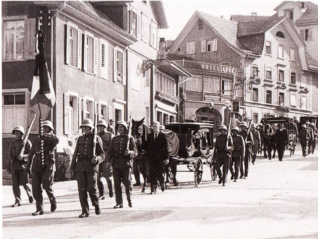
Abb. 69 Die Verstorbenen wurden in einem Umzug durch Rapperswil geleitet. 14