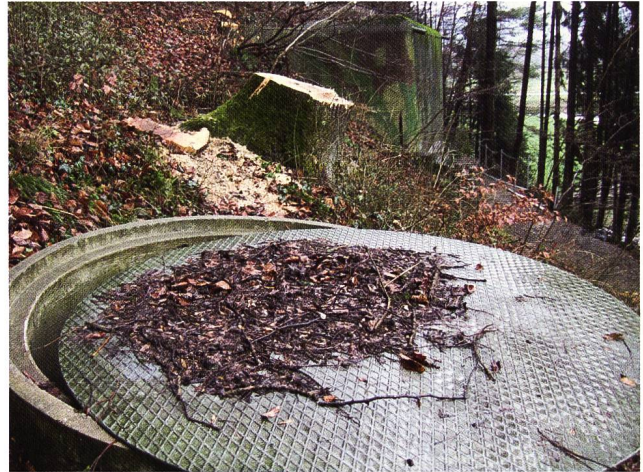
Abb. 67 Solitär mit Verschlussdeckel. Im Hintergrund Stand E

Die Truppe hatte als Schützenlöcher für die Lmg-Trupps so genannte Solitäre gebaut. Dabei handelte es sich um brusttief im Boden versenkte Betonrohre, die der Mannschaft Schutz vor Splintern und Beschuss bieten sollten (vgl. Abb. 68). 1939 und 1940 wurden auf dem Buchberg unzählige kleine Bunker gebaut. Der Kommandant der Ter Füs Kp II/146 erwähnt diese nicht als Element der Nahverteidigung, obschon sich zwei dieser primitiven Anlagen westlich und östlich des Notausgangs befinden (vgl. Abb. 65). Sie scheinen nicht mehr genutzt worden zu sein, wengleich sie mehr Schutz vor Beschuss geboten hätten. Sie hatten aber sicherlich zum Nachteil, dass sie über ein kleineres Schussfeld verfügten.