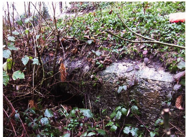
Abb. 68 Lmg-Stand östlich oberhalb des Notausgangs

Die tagelange Ausbildung an den Waffen für die Werksbesatzung scheint äusserst lang, doch der Kommandant der Ter Füs Kp II/146 war in der Kaderausbildung vom