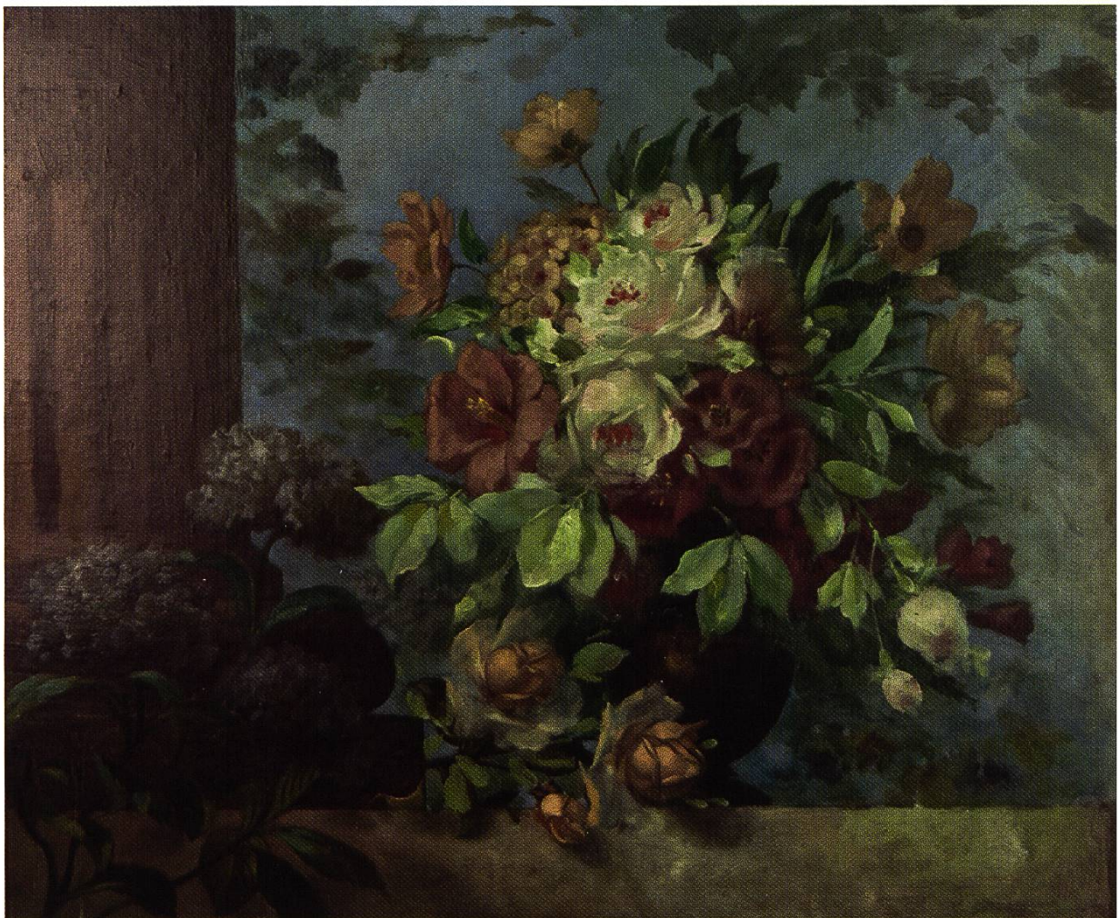
Pfingstrosen auf einer Steinplatte, E. 19. Jh. Öl auf Leinwand auf Pavatex. 56 x 67 cm. MR 2617

Farbimitationen, Modulationen sowie exakte Wiedergabe waren Sache des Dekorationsmalers. So interessierte sich Marius Beul auch für das Stilleben, denn dieses forderte den Maler zur scharfen Beobachtung und zur Behandlung von koloristischen Problemen heraus.