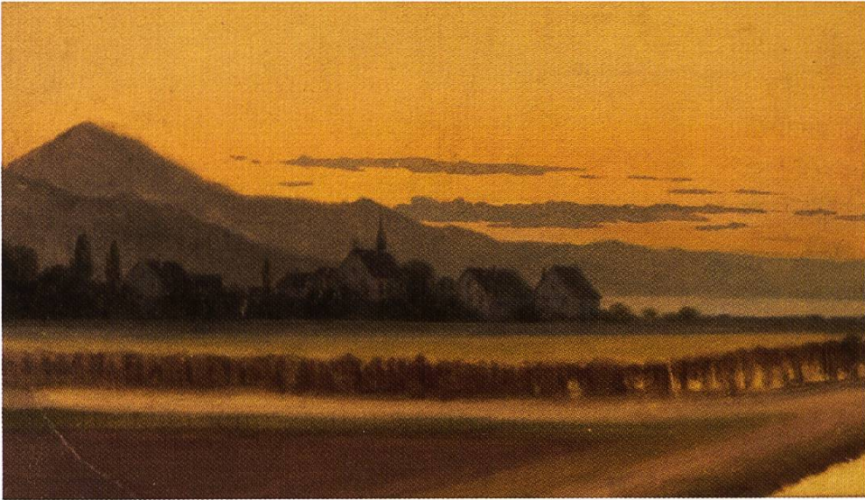
Abendstimmung bei Lachen, um 1880/90. Öl auf Karton. 26 x 41.5 cm. Gemeinde Lachen