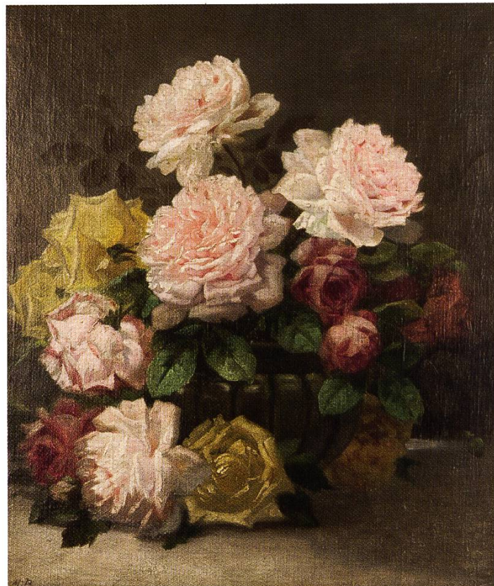
Rosenstrauß, E. 19. Jh. Öl auf Leinwand. 57 x 46 cm. MR LB 19