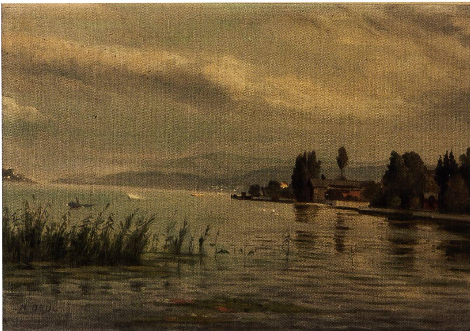
Ansicht vom Zürichsee, nach 1900. Öl auf Leinwand. 23.5 x 32.5 cm. MR LB 4