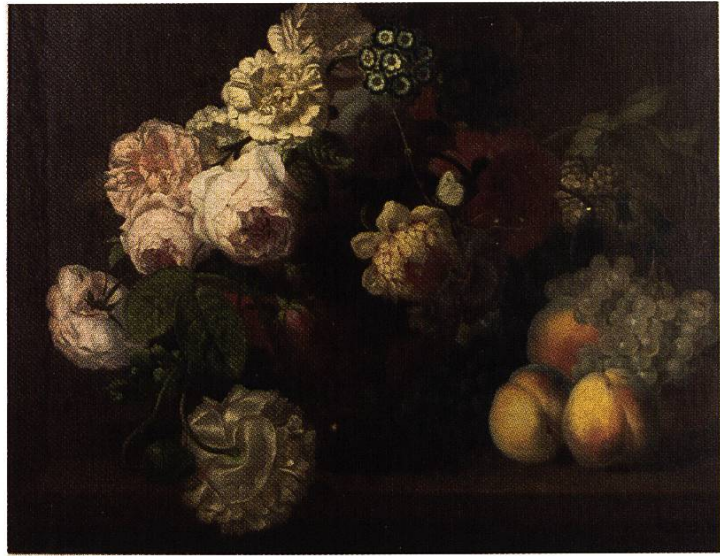
Jahreszeiten, Früchte und Blumen, E. 19. Jh. Öl auf Leinwand. 55 x 69 cm. Privatbesitz

Seine Blumen- und Früchte- stilleben heben sich effekt- voll vom meist monochro- men Hintergrund ab. Die Blumen sind als bunte Sträuße in einer auf einer Steinplatte stehenden Vase arrangiert. Sein in Hell- Dunkel-Schattierung wie- dergegebener Blumen- und Früchtezauber erinnert mit den einzelnen welken Blü- ten an die niederländische Stillebenmalerei. Die in akademischer Malweise und subtiler Farbgebung darge- botenen Naturalien wirken besonders dekorativ. Solche inszenierten Darstellungen waren beim Bildungsbürger- tum begehrt. Sie verliehen den historisierenden Speise- zimmern der Gründerzeit eine repräsentative Note.