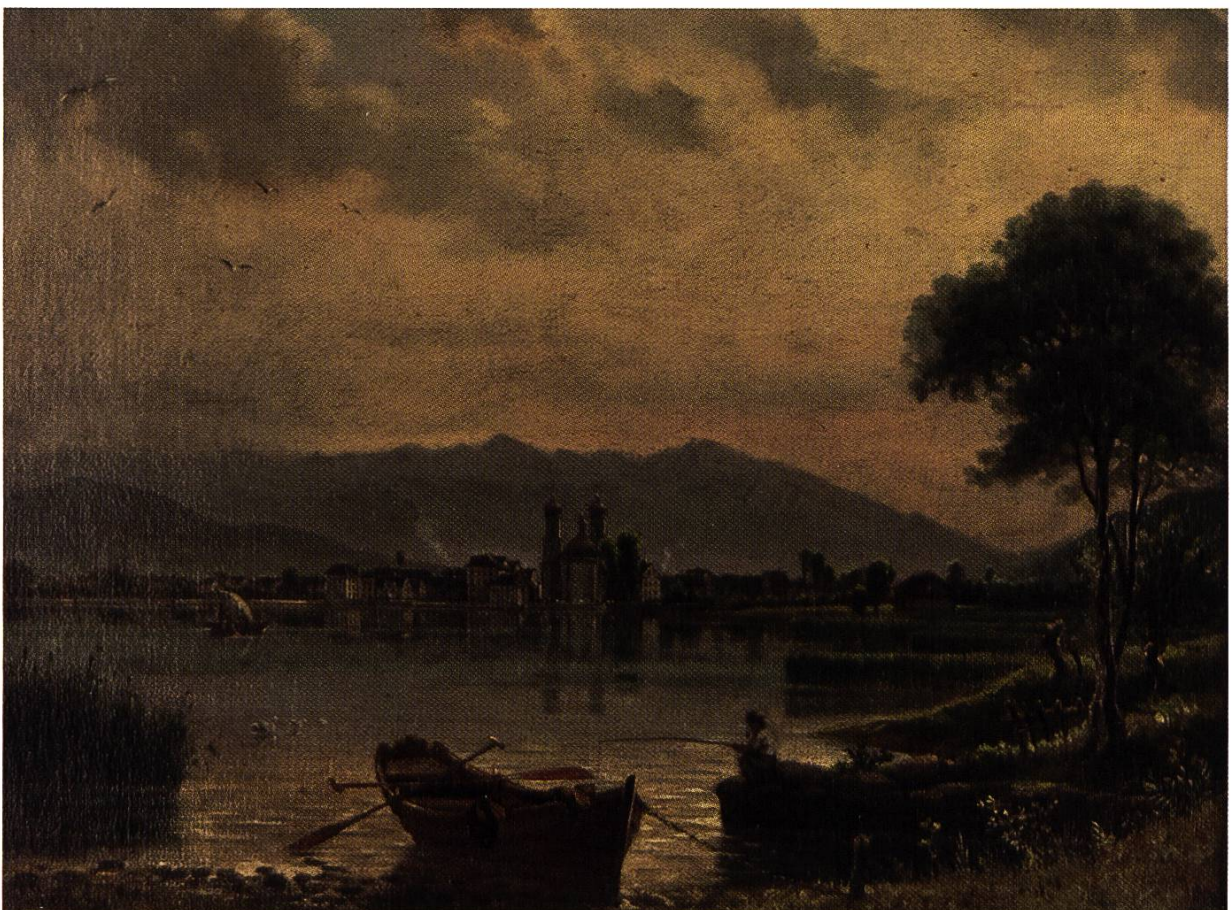
Lachen am See, 1884. Öl auf Karton. 26 x 35 cm. Privatbesitz