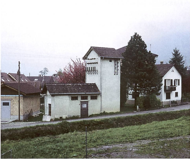
Die Trafostation Dorf am Rütibach musste zwischen 1911 und 1994 stetig dem Strombedarf der Bevölkerung angepasst werden. Ursprünglich ein Einzeltürmchen, um 1927 durch einen ersten Anbau erweitert, wurde ihm 1953 ein etwas dickerer Turm angefügt. Dieser Komplex bestand bis 1994 (fotografiert vor dem Abbruch). Rechts neben dem Nadelbaum findet sich das damalige Haus Bernardi und die Rütibachbrücke zum Burgschulhaus.

1950 verbrauchten die rund 1300 Einwohner Reichenburgs – oder knapp 400 Stimmbürger – fast 500 000 kWh Strom. Fast 250 Haushalte gehörten damals der AGR an. Waren schon bisher Wissenschaft und Industrie vorge-rückt, so wandelten sich seit dem Zweiten Weltkrieg Verkehr, Erwerb, Erfindungen und Gesellschaft turbu-lent. Reichenburg entwickelte sich mit: Neue Indust-rien, neues Gewerbe, neue öffentliche und private Bau-