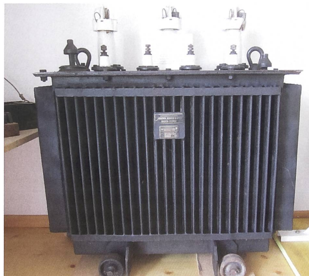
Der Drehstrom-Öltransformer der Firma Brown, Boveri & Cie., fotografiert im Elektromuseum Reichenburg von Armin Mettler.

spannungsschalter sowie gut 10 000 Franken für das Sekundärnetz mit Stromstangen und Kupferdraht.