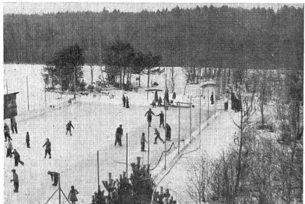
Im Winter dient der Tennisplatz als Eisbahn.