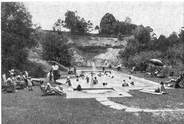
Regel Betrieb im Schwimmbad.

Der Betriebsleiter erklärte mir, dass der Zusammenhang innerhalb der Belegschaft durch die gemeinsame freiwillige Arbeit, die sich über einige Jahre erstreckte, bedeutend besser geworden sei. Die Freizeit (im Schichtbetrieb besonders schwierig zu gestalten) stelle lange kein solch schwieriges Problem mehr dar wie früher, haben doch die Leute für ihren körperlichen Bewegungsdrang ein natürliches Ventil gefunden. (Da die Belegschaft und ihre Angehörigen auch in kultureller Hinsicht etwas abgelegen sind, versucht die Betriebsleitung durch Vorträge, Filmvorführungen sowie durch Musik- und Gesangsveranstaltungen auch die geistig-seelische Seite zu pflegen.) Die Beweggründe der Betriebsleitung zum Bau der Sportanlage waren: