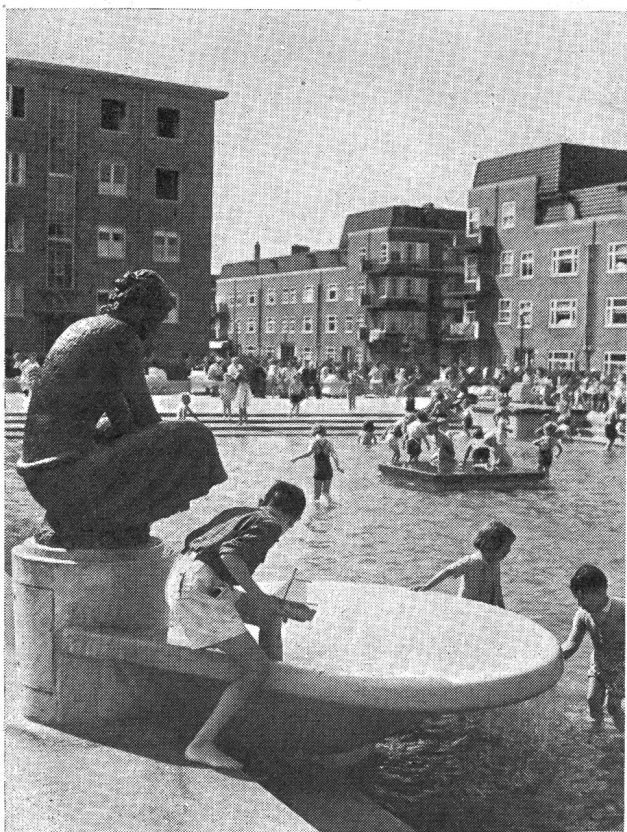
Abb. 5. Spiel- und Plantschweier in einem Mittelstandsquartier in Amsterdam, allen Kindern der Umgebung zugänglich.

Als in Rotterdam nach dem Kriege das unbändige Benehmen der Buben auf der Strasse solche Formen an-