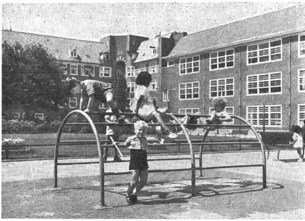
Abb. 2. Klettergerüst, wie man es heute auf Plätzen und in Grünanlagen oft antrifft.

denn man vertritt die Ansicht, dass die Familienbande nicht gelockert werden dürfen. Das Elternhaus soll immer an erster Stelle stehen, in zweiter Linie kommt dann die Schule und erst als dritte erziehende Kraft kommt der Spielgarten mit den verschiedenen Freizeitgestaltungsmöglichkeiten. So achtet man denn auch sorgfältig darauf, dass jedes Kind nur einem, höchstens jedoch zwei Clubs gleichzeitig angehören kann. Durch die zahlreichen Kinderspielplätze werden schätzungsweise 250 000 Kinder erfasst. Der Mitgliederbeitrag, den die Eltern zu entrichten haben, ist äusserst bescheiden, beträgt er doch nur 15 holländische Cents in der Woche, gleichgültig wieviele Kinder der Familie den Spielgarten besuchen. Der Unterschied zwischen der Spielplatzentwicklung in Holland und derjenigen in anderen europäischen Ländern besteht darin, dass fast überall sonst die Plätze von der öffentlichen Hand erstellt und geleitet werden. In Den Haag hat man es auch auf diese letztere Art versucht; die Haagschen Spielgärten sind aber ausnahmslos weniger besucht als die Plätze z. B. in Amsterdam, wo die Eltern aktiv mitarbeiten.