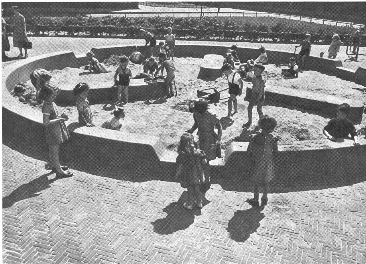
Abb. 1. Teilansicht eines öffentlichen Spielplatzes für Kleinkinder (entstanden nach 1947).

Ein Kind darf aber nicht zu vielen Clubs angehören,