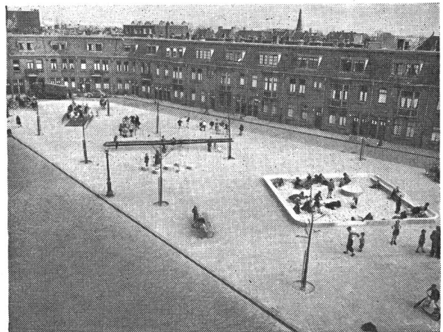
Abb. 3. Tummelplatz in einem Vorquartier. Ein Beispiel, wie in dichtbesiedelten Vierteln nachträglich noch Spielgelegenheiten für Kinder geschaffen werden können.

Strasse betreiben, möchte ich noch einige Zeilen widmen. Ich will mich hier aber auf Amsterdam beschränken, weil mir die Verhältnisse dort am besten vertraut sind und ich daselbst auch auf einige ganz interessante Einzelheiten aufmerksam geworden bin. Wegen Mangel an Heizmaterial wurden im letzten Kriegswinter in Amsterdam fast überall die vielen schönen alten Bäume gefällt. Auf vielen der so entstandenen leeren Stellen, namentlich auf Trottoirs und kleinen Plätzen, hat man jetzt versuchsweise einfache Klettergerüste und Turngeräte aufgestellt. Heute geht man je länger je mehr dazu über, auf breiten Trottoirs und in kleinen Grünanlagen einige Klettergerüste aufzustellen. (In den Grünanlagen waren ja sonst höchstens für die ganz kleinen Kinder Sandkasten oder dergleichen eingelassen).