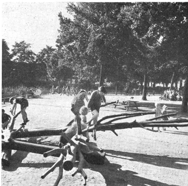
Abb. 6. Spielpark in Dänemark. Das Bild zeigt, wie mit einfachsten Mitteln fantasieanregende Klettergeräte erstellt werden können.

Das war der Erfolg der «Strafklasse». Er zeigt uns, wie gross das Bedürfnis der Jugend nach einem ge-