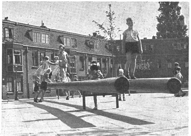
Abb. 4. Teilansicht des Spielplatzes der Abb. 3.

Es hat da Klettergerüste in allen Formen und Massen. Sie setzen sich aus unverwüstlichen Stahlrohren mit einer sehr gediegenen Fundierung zusammen. Die Installationen sollen dem Drang des Kindes zum Klettern, Kraxeln und Schwingen entsprechen. Es ist interessant, zu wissen, dass durch die Kinder gerade jene Übungen gemacht werden, welche die unterentwickelten Muskeln betätigen, denn jedes Kind hat ein inneres Bedürfnis, gerade diese zu gebrauchen. Daher sind diese Geräte von grösster Bedeutung für die gleichmässige Körperentwicklung. Auch ist es wahr-