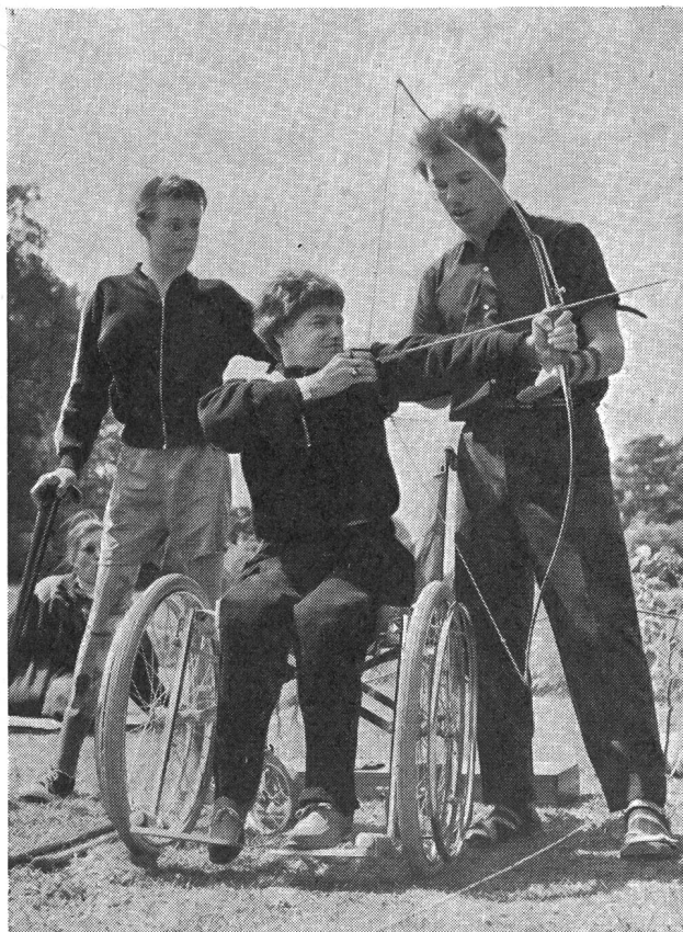
Das Bogenschiessen, das nicht nur Ruhe und Konzentration, sondern auch körperliche Anforderungen stellt, eignet sich deshalb besonders gut für Behinderte, weil es auch vom Wagen aus getätigt werden kann. Die Bogenschützen von Biel stellten liebenswürdigerweise Material und Lehrer zur Verfügung.

Das letzte Mittagessen! — Es wurde uns allen merkwürdig ums Herz, nun von diesen herrlichen Höhen wieder hinunter in den Alltag zu gehen. Aber wir werden wohl nie, nie diese Zeit der Kameradschaft, sowie der körperlichen Ertüchtigung vergessen. Denn jedes durfte Fortschritte machen. Eines verbesserte seinen schwerfälligen Gang, Kamerad Fritz lernte, statt mit