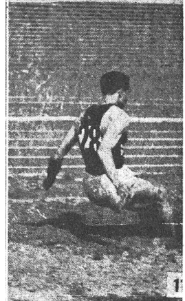
Bild 1: Schöne, aufrechte Auf- und Abbewegung des Körpers beim Absprung: kein Zurücklehnen und kein Verlieren kostbarer Geschwindigkeit.

Bild 2: Kräftiges Aufstossen des Führungsknies, um die Arme b. Absprung in die Höhe zu werfen.