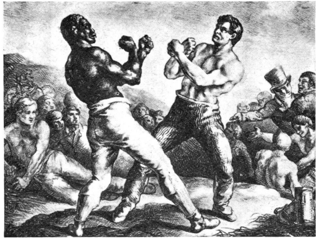
Boxmatch, gemalt von Théodore Géricault 1791—1824.

sondern das Training regte ihn auch geistig an, wie er wiederholt betonte.