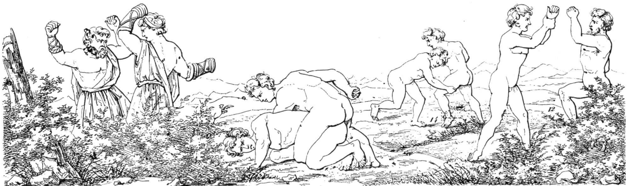
Faustkampf in der Antike nach einem Vasenbild, Kupferstich anfangs 19. Jahrhundert.

Nach dem Verfall der antiken Welt schwand das Interesse am Faustkampf. Vereinzelt haben zwar italienische Mönche im 12. Jahrhundert Ringen und Pugilismus gepflegt und unter der Herrschaft König Alfred d. Gr. (871—901) gehörte der Faustkampf in England zur Ausbildung der Soldaten. Auch wenn König Richard I. (1189—1199) Herz und Hand seiner Prinzessin nicht durch einen Faustkampf erobert hat, wie dies Shakespeare in dichterischer Freiheit schon im frühen 17. Jahrhundert berichtet (zurzeit des Dramatikers) und in England allgemein üblich gewesen sein muss, also vor der Geburt des eigentlichen Boxens, das erst im 18. Jahrhundert aufkam. Dass Boxen, in England geboren, zwar wie das Rudern kein altenglischer Sport ist, geht allein daraus hervor, dass der verdiente Kul-