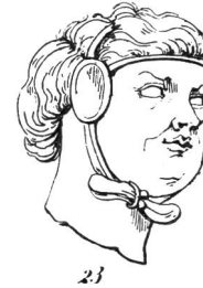
Ohrenschutz des Boxers in der Antike, nach einer alten Plastik.

der schon erwähnte Plato, Aristoteles, Pythagoras und später bei den Römern Virgil. Die einfachen Lederbandagen wurden etwa im 4. Jahrhundert v. Chr. durch die gefährlicheren, schon genannten, Sphairai ersetzt und im alten Rom kamen die mit Dornen versehenen Lederriemen, der Cästus, auf. Es wäre aber falsch, in den römischen Gladiatorenkämpfen, die oft bestialische Formen annahmen, nur die Verrohung der Sitten zu sehen. Diese Mann-gegen-Mann-Kämpfe standen in engem Zusammenhang mit Totenfeiern, wie sie schon in den Gesängen Homers geschildert worden sind. Schied ein Fürst oder Heerführer aus dem Leben, so wurden zu seinen Ehren Memorialkämpfe abgehalten, an denen sich die nächsten Freunde und Diener beteiligten. Kämpfe, bei denen es oft Tote gab, die dann mit dem Verblichenen als Opfer bestattet wurden. So waren auch die Faustkämpfe in den römischen Arenen noch Teile dieses Rituals, auch wenn jetzt an Stelle der Edlen bezahlte Gladiatoren sich «opfern» mussten.