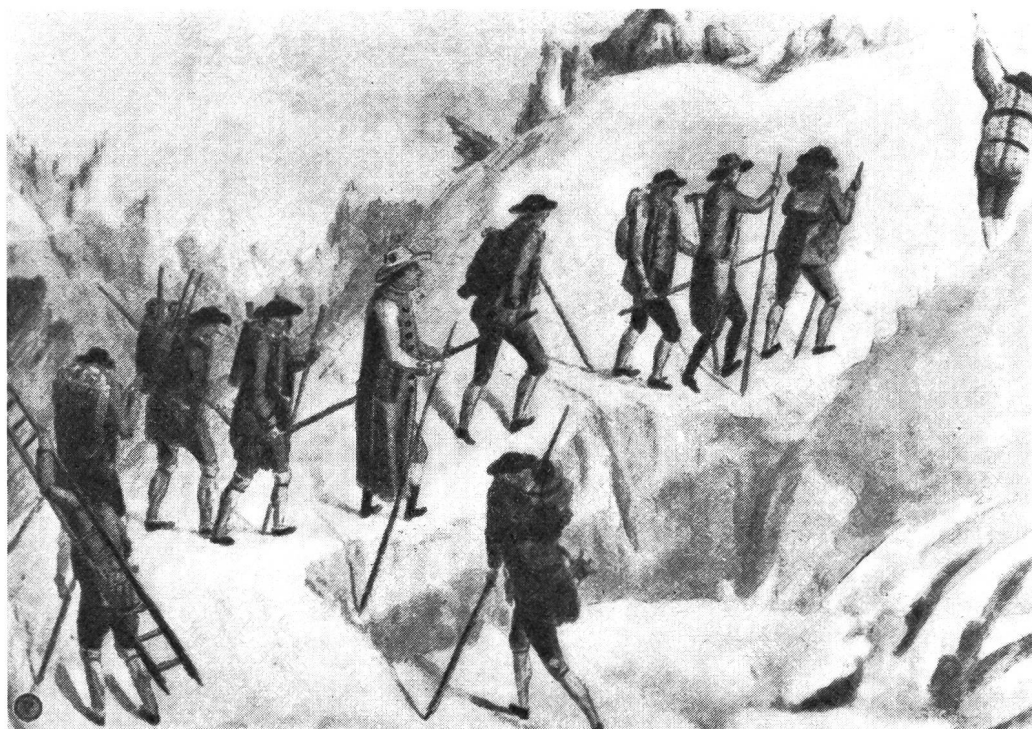
Ein Bergsteiger mit seinen Helfern beim Begehen eines Gletschers gegen das Ende des 18. Jahrhunderts. Der Rucksack war noch unbekannt, Tornister und Tragkörbe ersetzten ihn. Als ein wichtiges Requisit wurde eine Leiter mitgetragen.

Als um die Mitte des 19. Jahrhunderts Gipfel um Gipfel erobert wurde, führte man für Damen und marschuntüchtige Personen die sogenannten «Tragsessel-Routen» ein. Noch im Bäderer von 1869 sind solche Touren angeführt, z. B. die Rigi und das Faulhorn. Die Kosten für das Hinauftragen durch vier Mann auf einem Tragsessel mit langen Stangen beliefen sich, nach dem heutigen Kaufwert des Geldes jener Jahre berechnet, etwa auf 90 Franken. Bis gegen 1880 wurden viele Aussichtsgipfel auf solche Art besucht, dann aber war dieses «Bergsteigen» überlebt. Es wurden bessere Wege und Berggasthäuser gebaut, und der 1863 gegründete SAC sorgte für hochalpine Unterkünfte. In der Ausrüstung der Bergfreunde verschwanden Zylinderhut und Frack, Tragkörbe, Leitern und Küchenbeile. Die Seiltechnik wurde entwickelt und auch Einzelgänger erreichten hohe Gipfel. Die Kindertage des Alpinismus hatten damit ihr Ende gefunden.