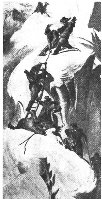
So bezwang man Anno 1853 schwere Passagen. Auch für solche Abenteuer trennte man sich nicht von Zylinderhut und Frack.

Diese verworrenen Vorstellungen dürften den einen Grund dazu ergeben haben, warum die Kindertage des Alpinismus noch gar nicht so schrecklich weit zurückliegen, der andere darf wohl in der Unerschlossenheit der Gebirgsgegenden gesehen werden. Bahnen gab es natürlich keine, befahrbare Wege nur wenige. Routenmarkierungen und genaue Karten waren unbekannt.