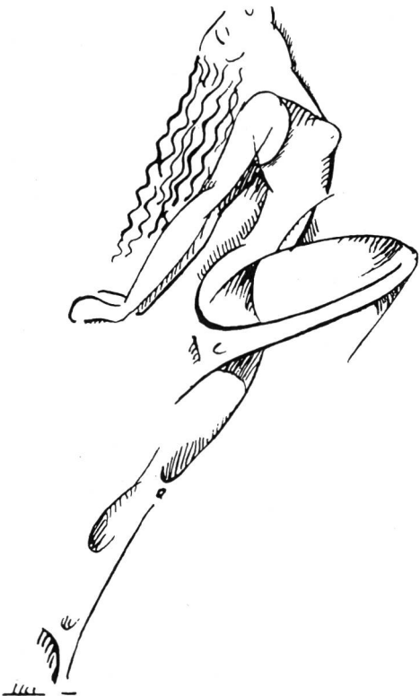
Dessin de Paulet Thévenaz pour la Méthode Jaques-Dalcroze (1916)

«Meine Methode ist in der Musik begründet, weil diese eine gleichzeitig anregende und regulierende Wirkung hat, welche die Dynamik der menschlichen Bewegung in allen zeitlichen und räumlichen Nuancen anordnen kann. Sie kann das Nervensystem beruhigen und dem Gehirn eine bleibende Erinnerung von rhythmisch geregelten Sinnesempfindungen einprägen. Die Musik – im griechischen Sinne des Wortes – ist ein erstrangiges Erziehungsmittel; deshalb besteht meine Methode darauf, grundsätzlich der Musik verbunden zu bleiben. Sie ist eine Schule zur Erhaltung des Selbstbestimmungsrechtes, die zu stetem Sich-