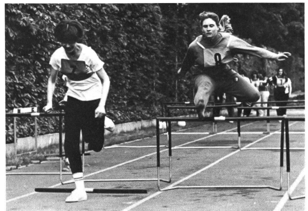
Techn. Training Hürdenlauf