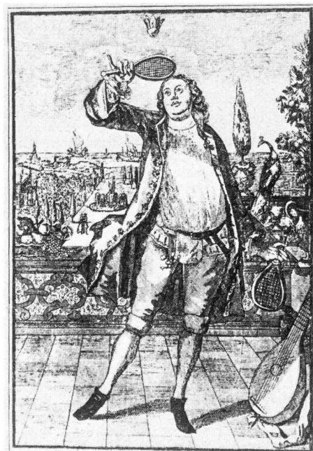
Federballspielender deutscher Prinz. 18. Jahrhundert.

Nach den USA kam Badminton schon kurz nach der Jahrhundertwende, hat aber erst nach 1930, als es von vielen Filmstars in den Gärten ihrer Bungalows praktiziert wurde, seine ersten Höhepunkte erreicht. Ein internationaler Verband konstituierte sich 1934 in London, und als nach den Olympischen Spielen von 1948 die Weltmeister des «neuen» Spiels, die Malaien, Europatourneen unternahmen, begeisterte Badminton allerorten die Sportfreunde, so dass überall Klubs und Spielplätze entstanden.