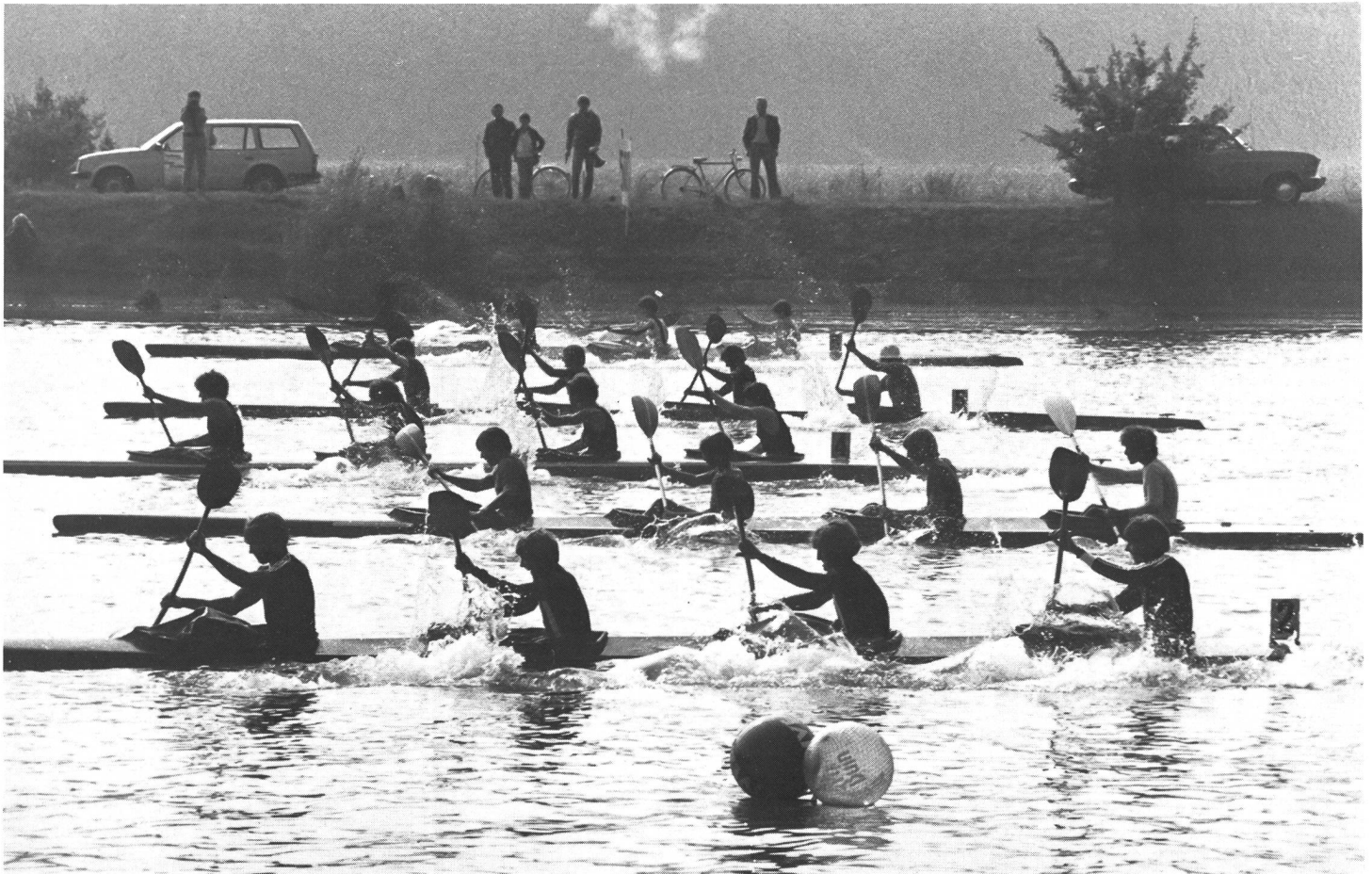
Rassige Kanu-Regattameisterschaften 1981 in Aarberg, Start der Viererboote.

Auf den 25. Oktober 1982 suchen wir eine Lehrkraft für das Fach