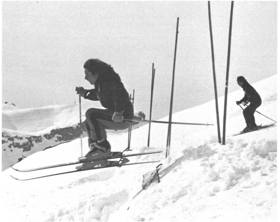
Eine Schanze als zusätzliches Hindernis.