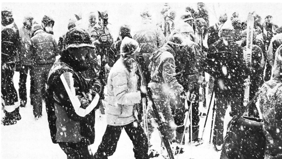
Schneesturm am Samstag auf der Wengernalp: Aus für das Lauberhorn-Abfahrtsrennen 1983.

Die Tendenz, Abfahrtsstrecken immer schneller zu machen um höhere Durchschnittsgeschwindigkeiten zu erreichen, ist kaum zu übersehen. Während der Sommerzeit werden oft Geländeschwierigkeiten mit dem Bulldozer entschärft, eben zu autobahnähnlichen Strecken abgeändert.