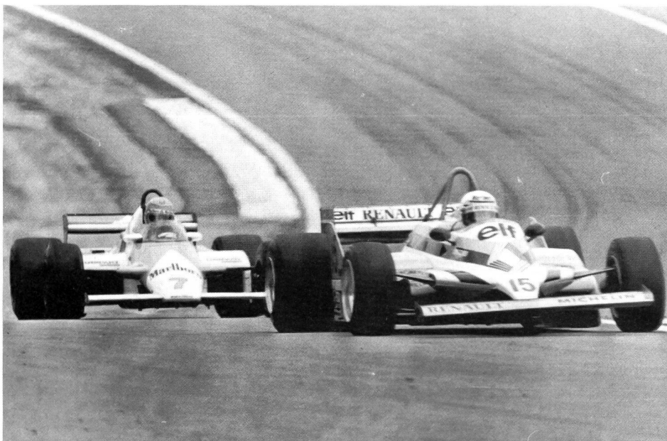
Risikosportart Automobilrennen: Vorne Alain Prost (F), bedrängt durch John Watson am GP von Dijon.

Wenn zu Beginn von Lernprozessen optische Informationen von Bewegungen eingespielt werden, können diese die Aufnahmekapazität des Lernenden übersteigen. Er kann eventuell Teilbewegungen nicht erkennen, so dass die mangelnde Durchschaubarkeit der Aufgabe bereits Ängste auszulösen vermag. Umgehen können wir dieses Problem, indem Bewegungen langsamer vorgemacht beziehungsweise durch Bildreihen oder Zeitlupenaufnahmen vermittelt werden. Dadurch wird dem Lernenden zwar ein falsches Vorbild bezüglich dynamischer Momente der Bewegungsausführung vermittelt, lässt dem Lernenden jedoch länger Zeit, sich mit den einzelnen Teilaspekten der Gesamtbewegung gedanklich auseinanderzusetzen. Ist die Gesamtbewegung strukturiert, kann der Film (das Vormachen) wieder in normalem Tempo geschehen, um eine Verzerrung der Dynamik bei der Entstehung der Bewegungsvorstellung zu vermeiden. Gerade durch dieses Hilfsmittel kann die Angst aus Orientierungsmangel ausgeschaltet werden, indem der Lernende grösstmögliche Informationsgüte erhält.