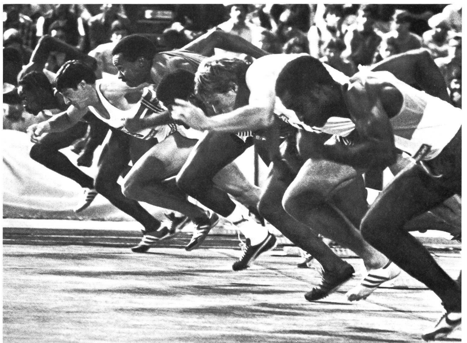
Geballte Angst beim 100-m-Start?

Die Exaktheit der Bewegungsvorstellung kann ein gutes Stück dazu beitragen, angstreduzierend zu wirken. Bewegungsaufgaben müssen dabei exakte verbale, taktile und optische Informationen enthalten, die sich streng auf die individuellen motorischen Vorerfahrungen beziehen müssen (siehe dazu Daus: syntaktischer, semantischer und pragmatischer Aspekt 18 ). Die gesamten Informationen müssen so exakt wie möglich eingespielt werden und Begründungen enthalten, warum die Aufgabe mit seinen Details so zu absolvieren ist. Unfälle können dadurch vermieden werden, weil die Steuerungs- und Regelungsmechanismen beim sensomotorischen Lernprozess genauer ablaufen und Fehlhandlungen weitestgehend ausgeschaltet werden.