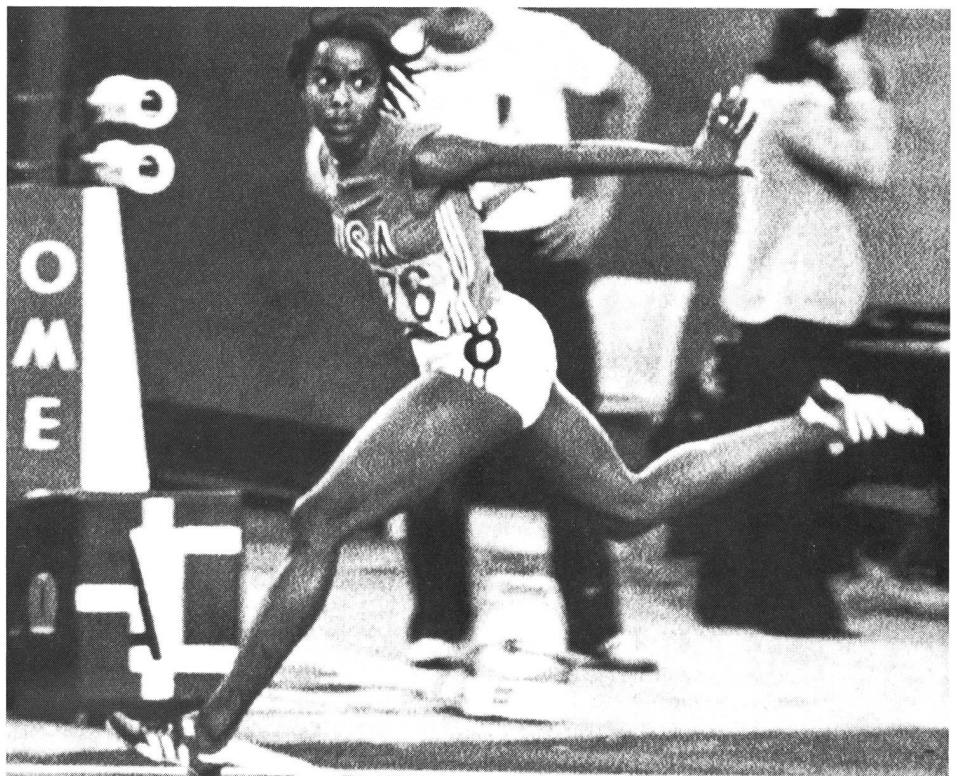
Die Angst im Nacken: Angst, auf der Ziellinie noch verlieren zu müssen, selbst bei der überlegenen Siegerin Evelyne Ashford (USA) im 200-m-Lauf in Montreal.

«Ein Trainer muss mit der Erkenntnis bei sich anfangen. Er muss, soweit dies überhaupt möglich ist, sich selbst zu erkennen suchen. Durch diese Selbstbeobachtung muss er seine Grenzen finden. Nur diese Selbsterkenntnis ermöglicht es ihm, auch bei anderen Menschen Reaktionen und Aktionen beurteilen zu können. ... Die Arbeit des Trainers gelingt nicht, wenn man keine Persönlichkeit und nicht selbstkritisch ist.» (Dettmar Cramer, zitiert aus Gabler et al., 1979, S. 103)