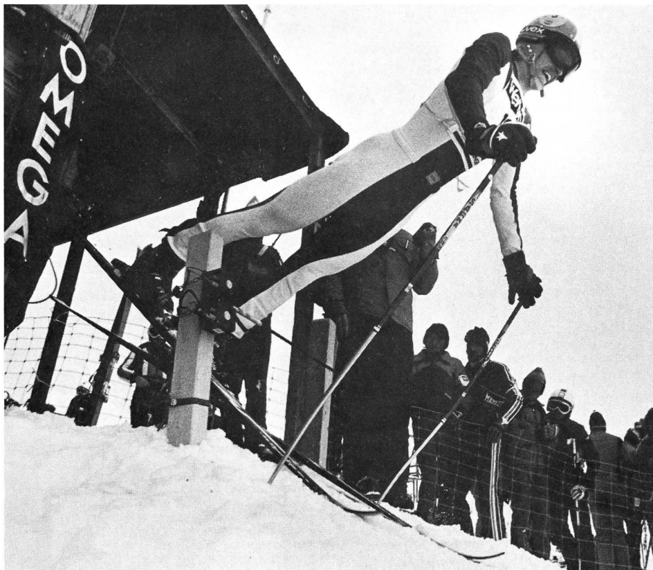
Start bei alpinen Skirennen: Befreiung von der Angst? Soeben gestartet: Bernhard Russi.

ein Erregungsoptimum hinaus, kommt es zu negativen Einflüssen auf Wahrnehmungsleistungen und es entstehen Störungen.