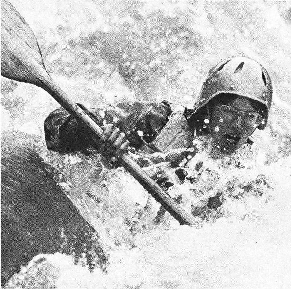
Im tosenden Wildwasser fährt bei den Kanuten die Angst mit.

«Meta ist ängstlich. Sie hat viel Angst. ... Als Trainer bin ich froh um diese Angst. Diese Angst von Meta ist kontrolliert und vermittelt ihr jene besondere Energie, die sie für ausserordentliche Leistungen braucht. Denn solch kontrollierte Angst bewirkt Erregung, gibt Energie frei, schärft die Sinne und schafft Bereitschaft. Zusammen mit ihrer grossartigen Konzentration gelingt es darum Meta jeweils gerade an grossen Wettkämpfen, ihre Bestleistungen zu erzielen.» (Müller, J., 1972, S. 51)