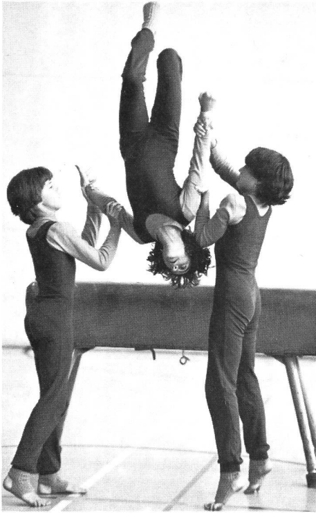
Angstreduktion durch Hilfestehen beim Geräte-turnen.