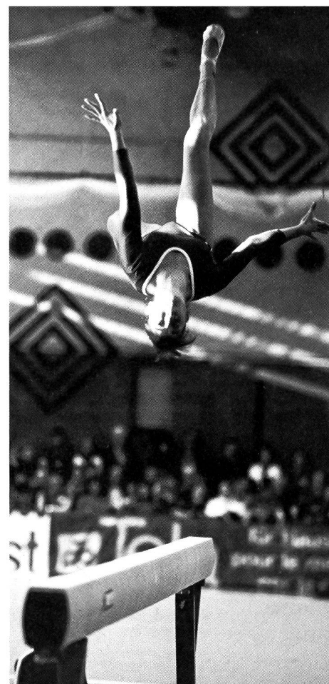
Der Schwebebalken: Angstgerät der Kunstturnerinnen.

dem Begriff Angst existiert noch der Begriff Furcht. Dieser meint die spezifische Beziehung zu einem Gegenstand. In der wissenschaftlichen Diskussion haben einige Vertreter sich mit beiden Begriffen auseinandergesetzt und die enge Verflechtung herausgearbeitet 6 . Da beide Begriffe oft synonym gebraucht werden, wählen wir den umfassenderen Begriff der Angst bei unseren weiteren Ausführungen.