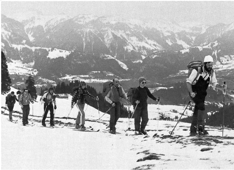
Die Klasse der «Romands» des 1. Leiterkurses Typ F im Aufstieg zum Niederhorn (Simmental) bei trübem Wetter.