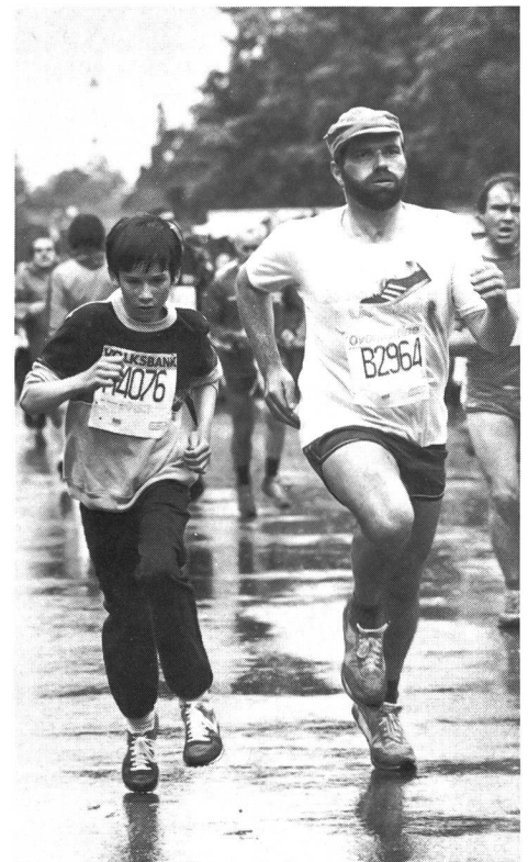
Vater und Sohn nehmen gemeinsam an einem Volkslauf teil.