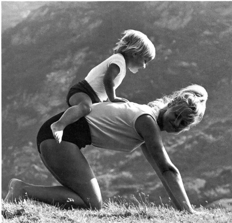
«Muki»-Turnen, innige Mutter-Kind-Beziehung.