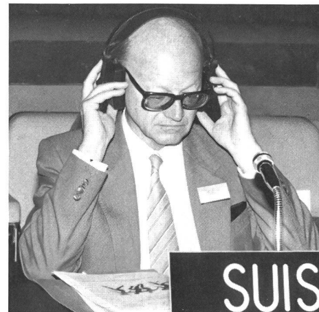
Bundesrat Alphons Egli in Malta.

Eine Arbeitsgruppe hat im Hinblick auf die Konferenz eine Charta gegen das Doping im Sport vorbereitet. Sie wurde eingehend diskutiert und auch verabschiedet. Die Mitgliederländer werden darin verpflichtet, mit geeigneten Massnahmen gegen den Dopingmissbrauch vorzugehen. Auch Bundesrat Alphons Egli hat in die Diskussion eingegriffen und den Standpunkt der Schweiz erläutert. Er stellte dabei fest,