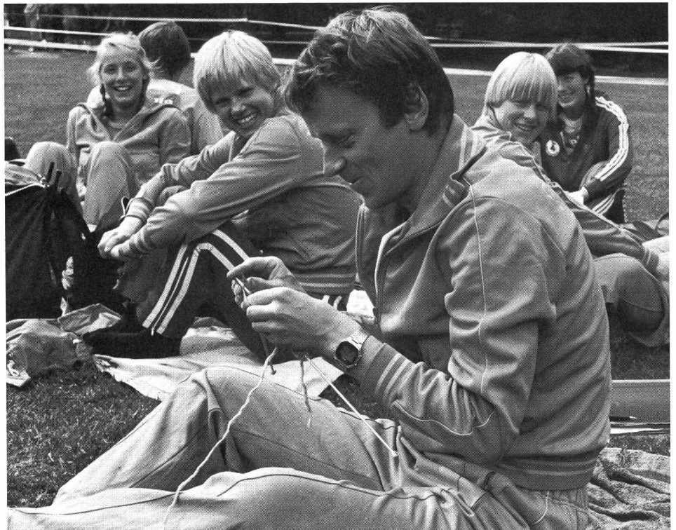
Psychoregulatives Training mit Stricken?

Es motivierte unheimlich, stärkte mein Selbstvertrauen und es wurde mir eingesugert, dass die Konzentration voll da sein würde.