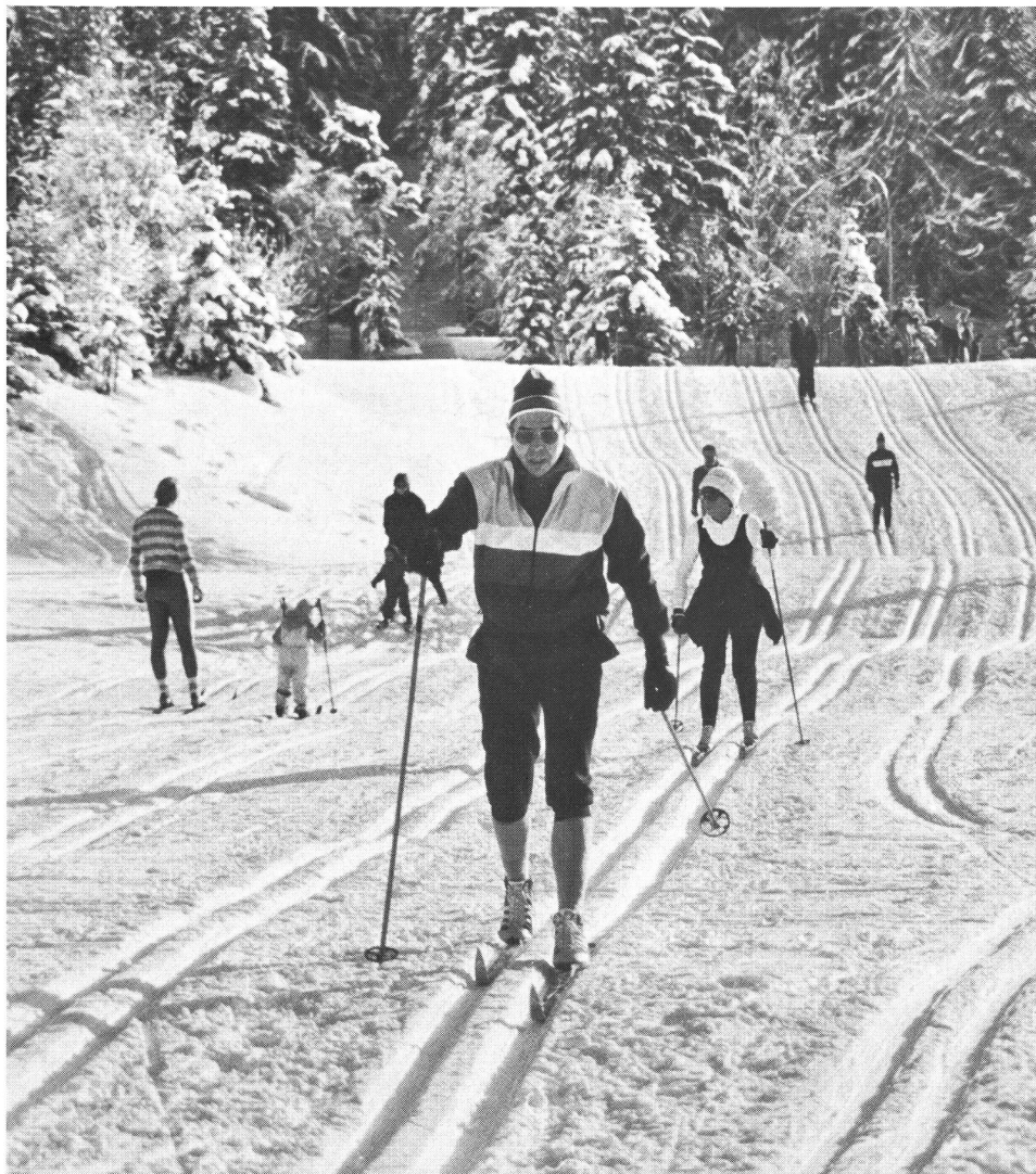
Mit dem Aushängeschild «LLL – Langläufer leben (angeblich) länger», ist Skilanglauf zum Volkssport geworden. Gut gespurte Loipen sind allerdings Voraussetzung dazu.

Erst in den frühen sechziger Jahren konnte man am Rande von Wettkampfloipen mitgehende Zuschauer in grösserer Zahl beobachten; neben Helfern und Enthusiasten tauchten auch Vertreterinnen des zarten Geschlechts mit Langlaufski an den Füssen auf. Mitverantwortlich für Impulse zur Ausbreitung des schmalen Ski war parado-