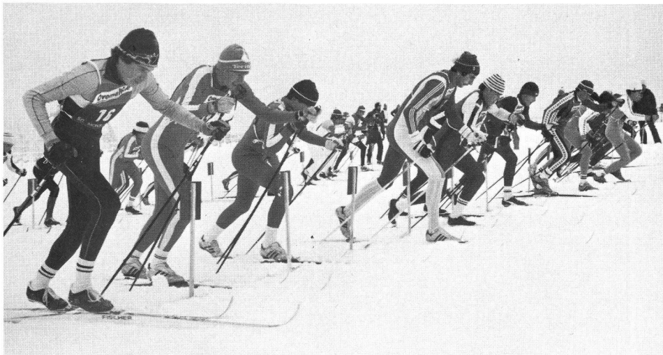
Start zur Staffelmehrschaft auf Mont-Soleil (Berner Jura) Januar 1984.