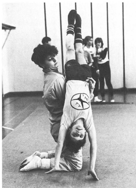
Buben und Mädchen turnen im TV Rütli gemeinsam.

Der TV Rütli erfüllt auf vielfältige Weise seine gesellschaftliche Aufgabe. Er bietet den Jugendlichen ein soziales Übungsfeld, wo sie gemeinsam mit Erwachsenen gleiche Ziele verfolgen, wetteifern können, wo die Jugendlichen aber auch lernen, sich für eine Gemeinschaft einzusetzen, auch wenn es einem nicht immer gerade so passt. Im TV finden Jugendliche einen Halt; dort gelten gewisse Werte, Traditionen. In der Zusammenarbeit mit Jüngeren und Älteren lernen sie kommunizieren und die dazu notwendige Toleranz. Eine 16jährige sagt dazu: «Manchmal stören die Kleinen schon durch ihre Unruhe, sie gehen einem so recht auf die Nerven, aber durch uns lernen sie sehr viel, sie lassen sich durch unsere Leistungen motivieren.»