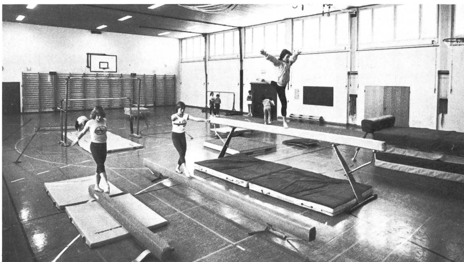
In dieser gut ausgerüsteten Sporthalle ist der TV Rütli zu Hause.

ist in unserer Gesellschaft rar geworden. In der Riege kann man das: Man darf einmal richtig wütend werden, wenn zum x-ten Mal ein Element doch nicht gelingt, man darf einmal weinen über einen Absteiger