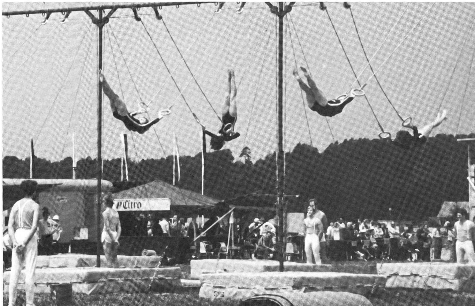
Kein Platz für «Stars» im TV Rütli: An den Turnfesten machen auch die Elite-Kunstturnerinnen und -turner im Geräte-Sektionswettbewerb mit.

vom Balken, über eine verpatzte Wettkampfübung, man freut sich aber auch gemeinsam über Erfolge und Resultate. Die Riege ist eine Gemeinschaft, in der man seine Identität wahren darf.