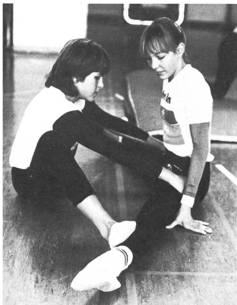
Einturnen am Samstag nachmittag.

geht auch über die Turnstunde hinaus. Viele pflegen auch ausserhalb des Trainingsbetriebs kameradschaftliche Beziehungen. Manchmal werden die Leiter auch Anlaufstelle für persönliche Fragen und können mit Rat aus ihren Lebenserfahrungen zur Problemlösung beitragen.