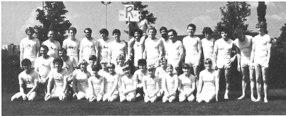
Typische «Turnfestphoto» des TV Rütli.