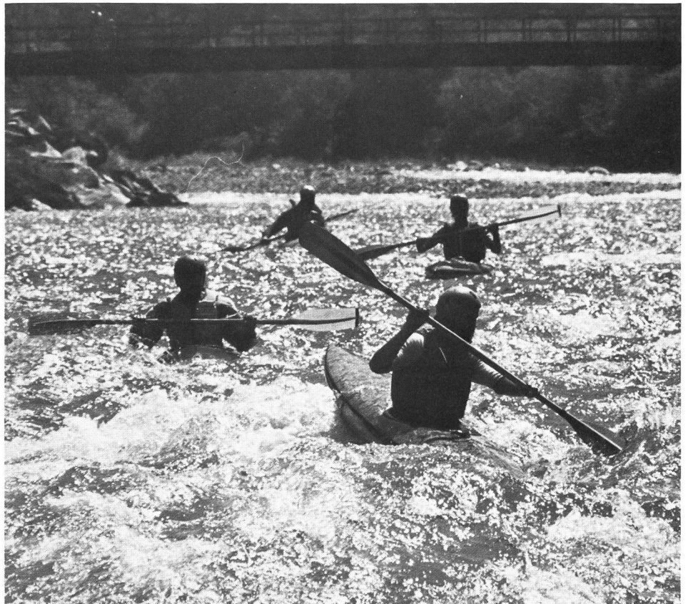
Die Moesa ist für Wildwasserräuber jedes Jahr eine Neuentdeckung.