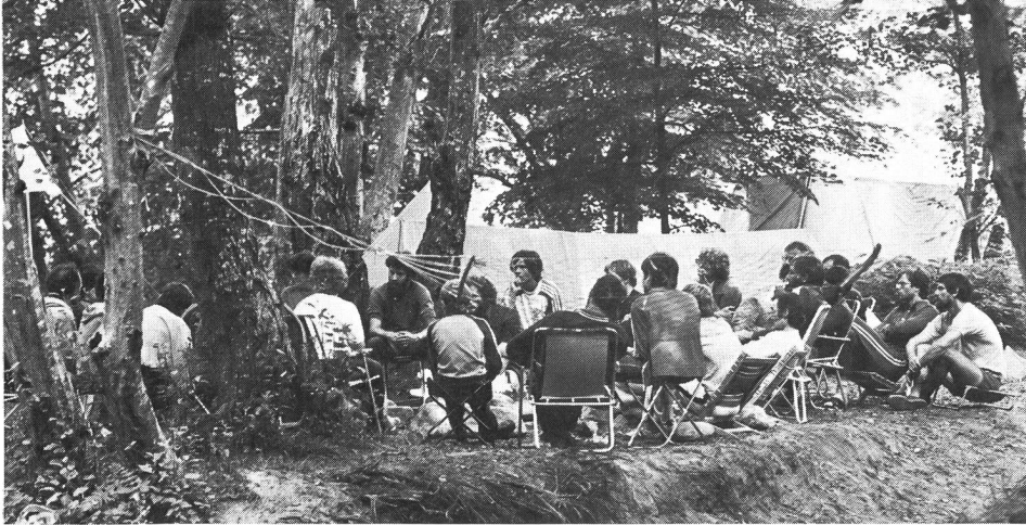
Kanulager des SVSS sind Zeltlager abseits von Komfort und Zivilisation.

ein bisschen befremdend, von Kindern, die kaum den Windeln entwachsen waren, geduzt zu werden, dieses «Du» selbst aber auch ergrauten, bestandenen Lehrerpersönlichkeiten gegenüber verwenden zu dürfen. Bald konkretisierten sich aber Peters Vorstellungen von der «grossen Familie». Ein Besucher hätte es schwer gehabt, herauszufinden, welcher Knirps zu welcher Mutter und welcher Hund zu welchem Herrchen gehörte.