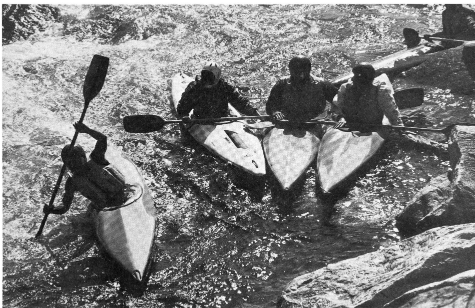
Die Moesa – ein Spielgarten für Kanuten aller Könnensstufen.

Persönlich erfuhr ich das Erlernen neuer Bewegungen an eigenen Körper und war nun als Lehrer viel besser fähig, mich in die