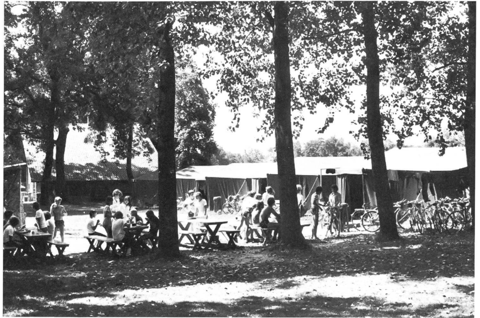
Das Zeltlager, Inbegriff von «Tenero» – auch in Zukunft.