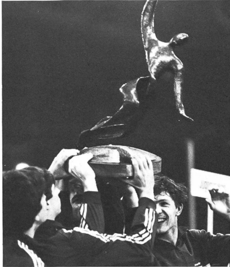
Siegestrunkene Jugoslawen mit WM-Pokal.