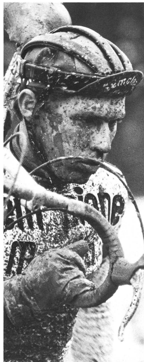
Albert Zweifel, Weltmeister.