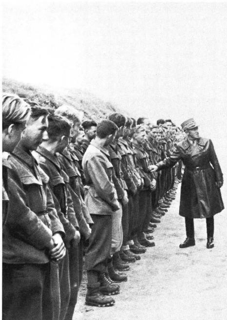
Kursinspektion durch General Guisan. Die VU-Teilnehmer trugen feldgrau (Ex-Tenü) mit Ceinturon. Unverzeihliche Nachlässigkeit (damals): einer trug den Gurt verkehrt!