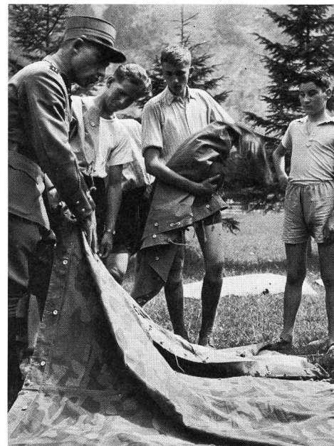
Die VU-Leiter waren zumeist Offiziere in Uniform, hier bei der Instruktion über den Zeltbau.