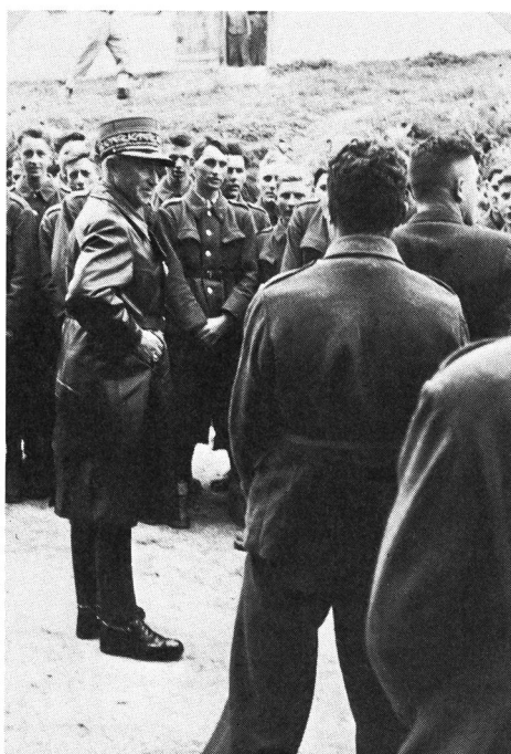
Besuch eines Zürcher Vorunterrichtslagers während des Zweiten Weltkrieges durch General Henri Guisan.

Es wäre dann das dritte Mal, dass der Kanton Zürich in der Geschichte des schweizerischen Jugendsports eine Pionierrolle übernehmen würde.