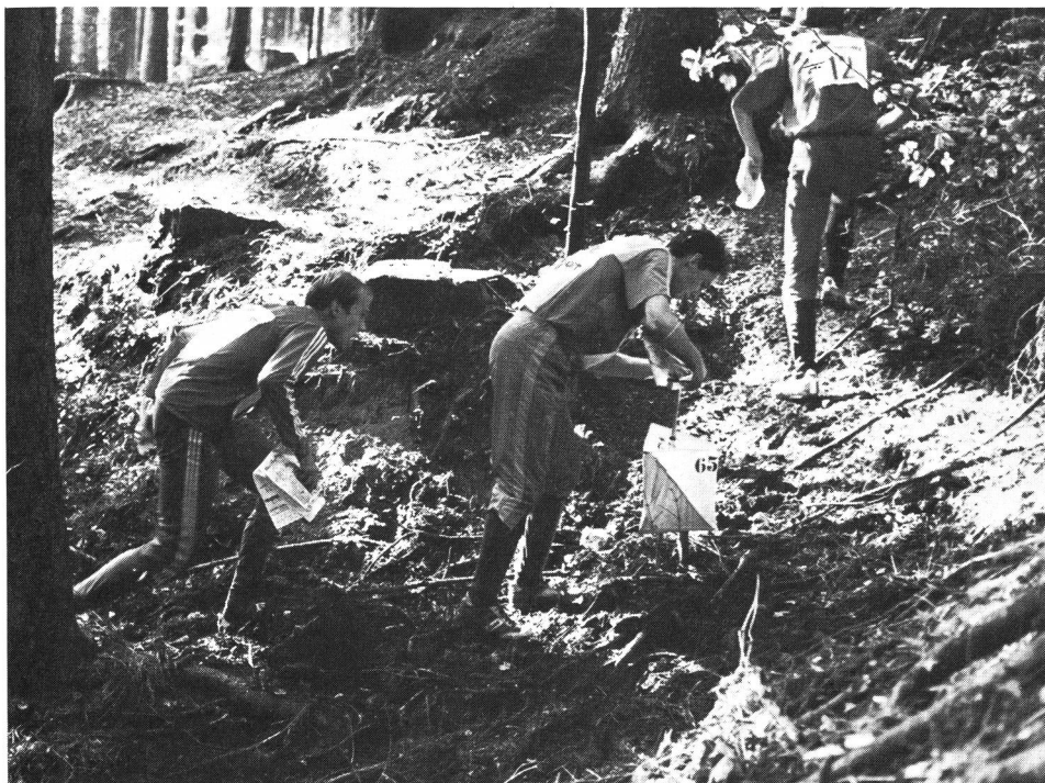
Orientierungslaufen, in vielen Wäldern mehr verwünscht als erwünscht. Zum Glück haben sich da und dort Jäger, Naturschützer, Förster, OI-Läufer und Landwirte an einen Tisch gesetzt und zu gemeinsamer Sprache gefunden.

in: Sport und Umwelt Akademieschrift 18 Führungs- und Verwaltungsakademie des Deutschen Sportbundes e.V., Berlin, 1984 ■