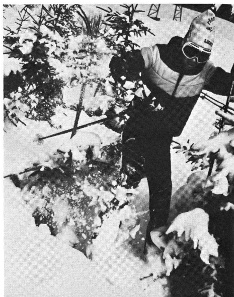
...gegen solches Variantenfahren im jungen Gebirgswald jedoch sehr viel.

Beispiel: Drachenfliegen, Varianten-Skifahren, Windsurfen.