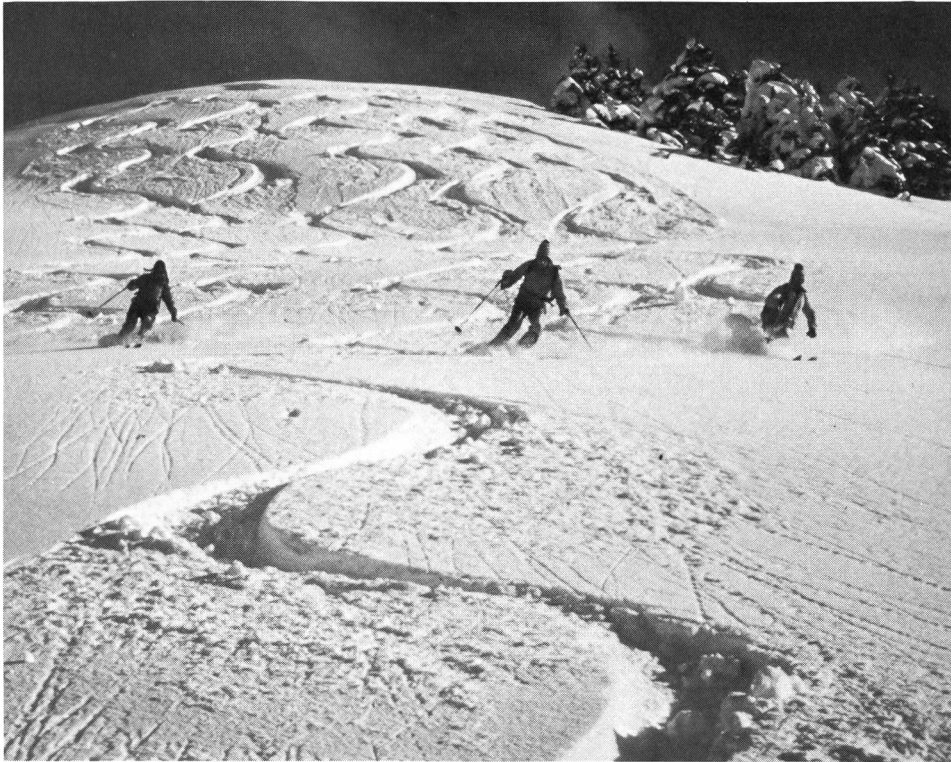
Fahren im stiebenden Pulverschnee, das totale Skivergnügen. Hier wird kaum jemand etwas dagegen einzuwenden haben...

Beeinträchtigung, Übernutzung und Zerstörung der Umwelt gehören zu den grossen Problemen unserer Zeit. Industrialisierung und ungezügelter wirtschaftliches Wachstum, rücksichtsloses Ausbeuten der natürlichen Ressourcen, unbedachte Entwicklung von Tourismus und Verkehr und das Bevölkerungswachstum bilden die Ursachen dafür, dass unsere natürlichen Lebensgrundlagen und damit auch die Grundlagen des wirtschaftlichen und gesellschaftlichen Lebens bedroht sind.