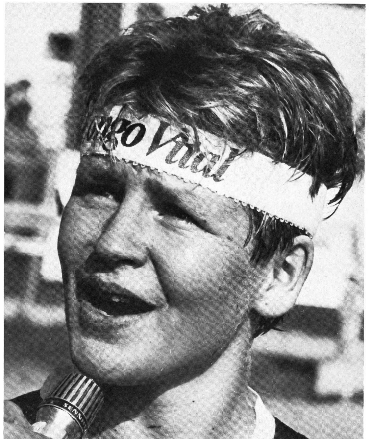
Die Norwegerin Ellen-Sofie Olsvik, unangefochtene OL-Weltcup Siegerin trotz relativ schlechter Laufzeit.