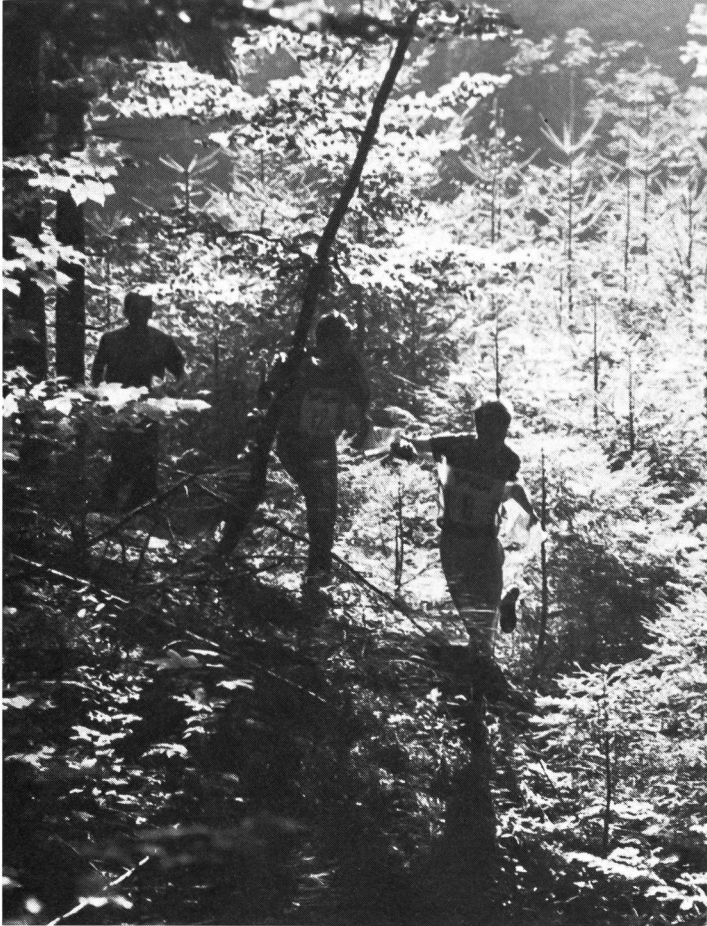
Der ganze Zauber des OL: Oevin Thon (Norw.), 3. Rang (nur mit einem Sieg hätte er den Weltcup gewinnen können), vor dem Schweizer Christian Aebersold, 19. Rang und Weltcup Sieger Kent Olsson im zweiten Lauf bei Posten 1.