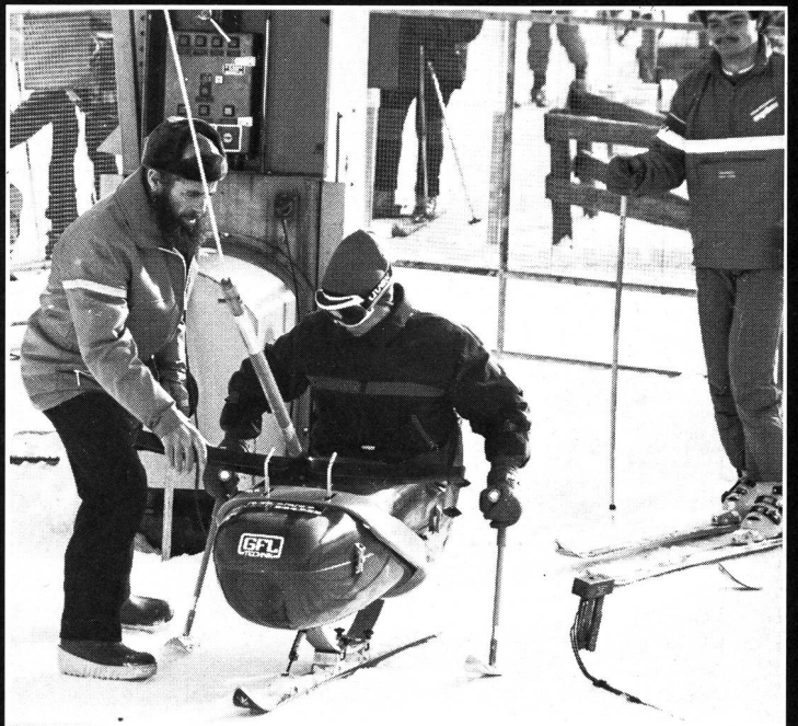
Keinerlei Integrationsprobleme am Skilift.