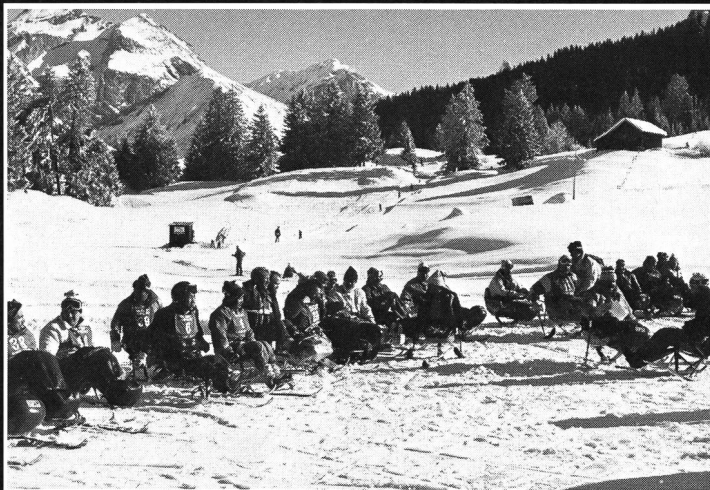
Wettkampfpause an der wärmenden Sonne.