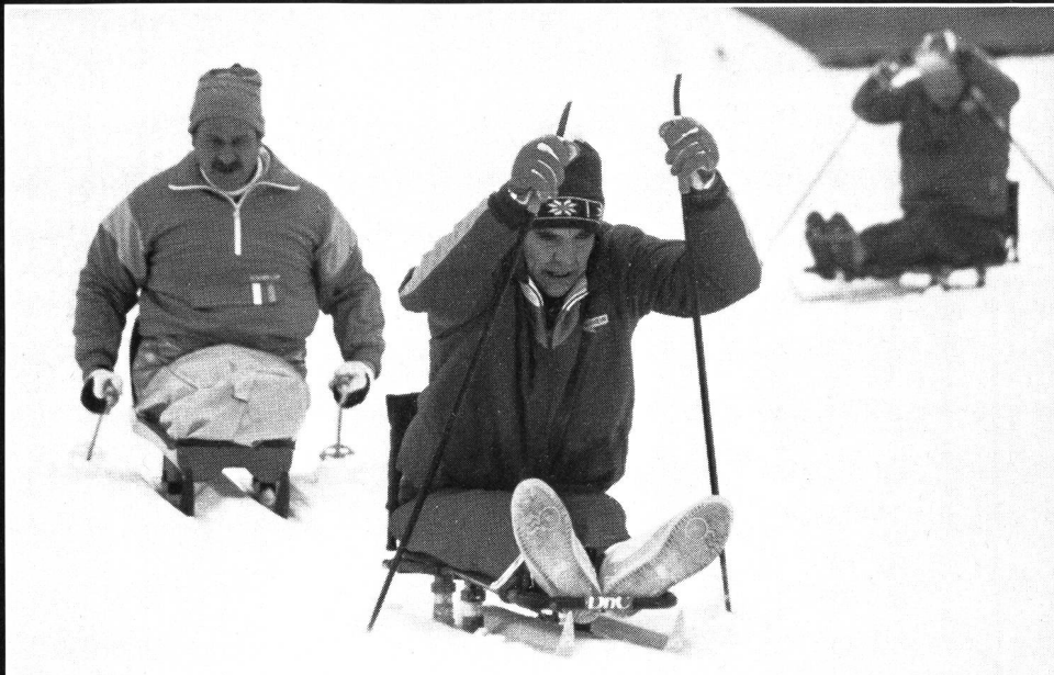
Loipenfreuden müssen mit härtester Arbeit erkaufte werden.