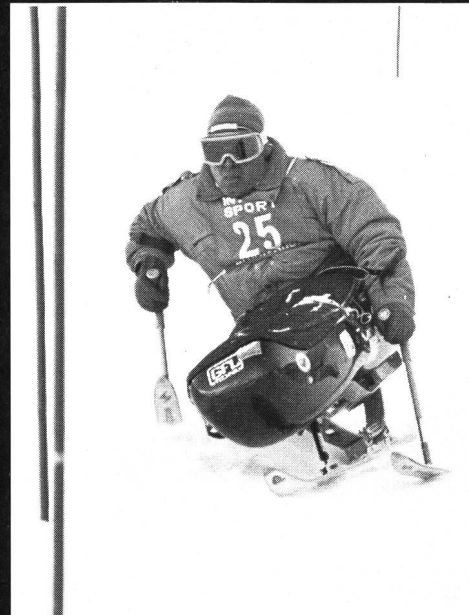
Slalom-Kunst auf dem Mono-Ski.