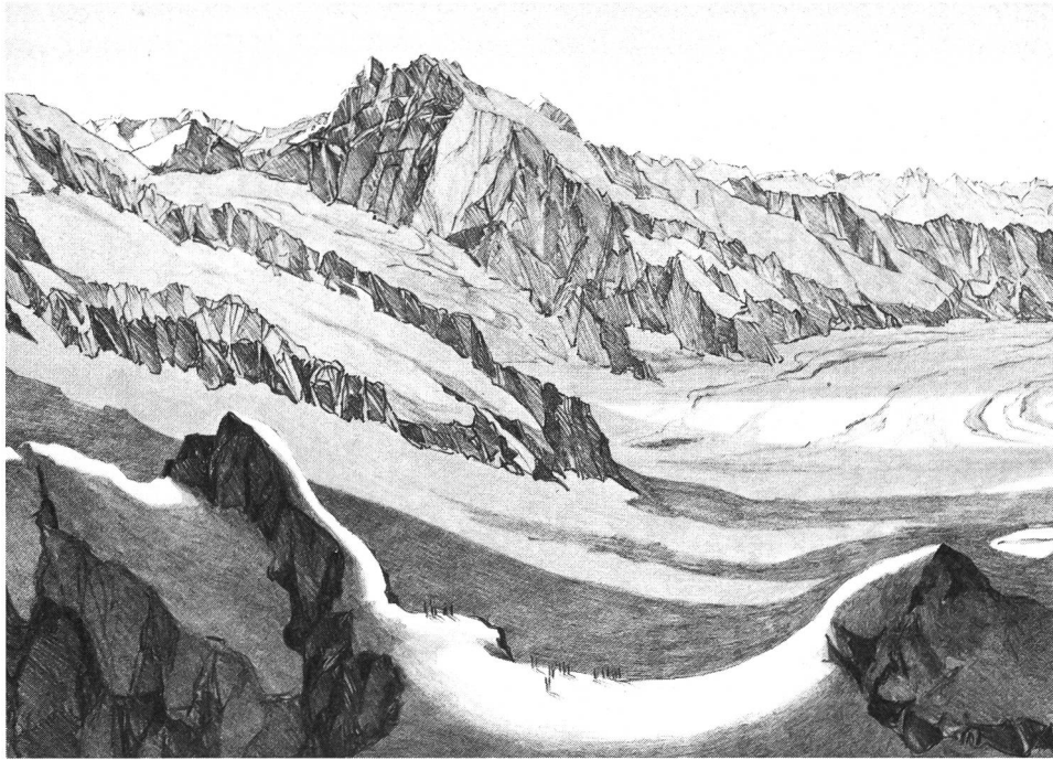
Ausschnitt einer Zeichnung von Alex W. Diggelmann, mit Blick auf Aletschgletscher und Finsteraarhorngruppe.

schiedene Streifzüge unternommen. Die Begeisterung für die Gipfelbesteigung blieb nicht aus. Eines seiner bedeutendsten Werke bezeichnete er: «Über die genaue Bestimmung der Schneegrenze an einem gegebenen Punkt.»