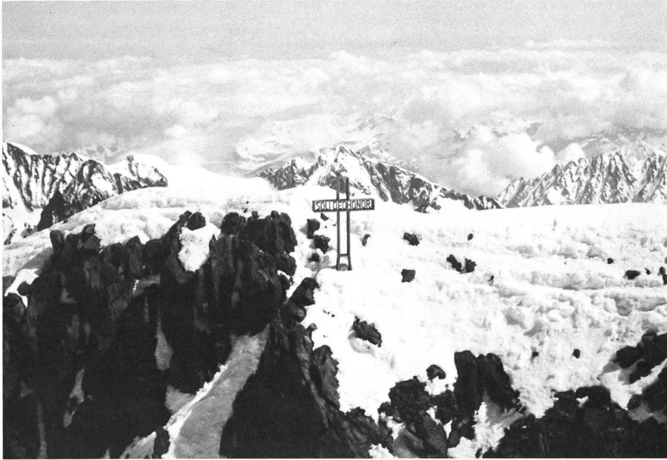
Das erst 1986 errichtete Gipfelkreuz auf dem Finsteraarhorn.