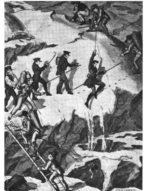
Erstbesteigungsversuch von Franz-Josef Hugi und Gefährten im Jahre 1829.