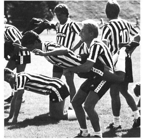
Juventus Turin beim Training.

Verletzungsrisiken im Sport erwachsen auch aus der Nichtbeachtung der notwendigen Wechselbeziehungen von Belastung-Ermüdung-Regeneration. Überbelastung im Training oder im Wettkampf führt mangels Kraft- und Konzentrationsfähigkeit als körperlich-psychische Ermüdungserscheinung zu empfindlichen Schwächen in der Gesamtkoordination der auszuführenden Bewegung. Die obligatorische Bewegung erfolgt dann meist technisch unsauber oder misslingt ganz und hinter-