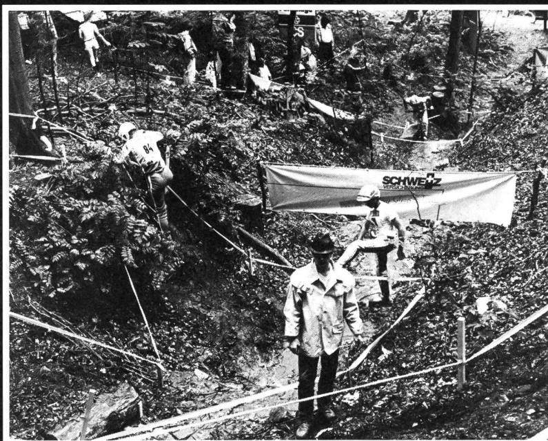
Überblick auf einen der 14 Wertungssektoren.

Velo-Trial, ein noch sehr junger Wettkampfsport für junge Leute. Mit einem Teilnehmeralter, welches bereits bei 10 Jahren und darunter beginnt und kaum die 22 Lenze überschreitet. Also halbwegs ein Kindersport, und dennoch so faszinierend, dass die grossen «Gstabi» mit etwas Neid auf die wendigen Knirpse blicken, welche auf ihren kleinen Vehikeln wie Flöhe in den Gräben unserer Wälder herumhopsen. Mit der unbekümmerten Lebenslust der Jugend und gleichzeitig mit dem Mut, der Ernsthaftigkeit und dem Können von Profis. Das Wort «Trial» kommt aus dem Englischen und bedeutet soviel wie «Prüfung». Und eine Prüfung ist Velo-Trial allemal, dazu eine recht harte, welcher sich jedoch die vom Trial-Virus Befallenen in Training und Wettkampf mit bewundernswerter Ausdauer und Disziplin unterziehen (was sonst nicht als Charaktermerkmal der jungen Generation gilt).