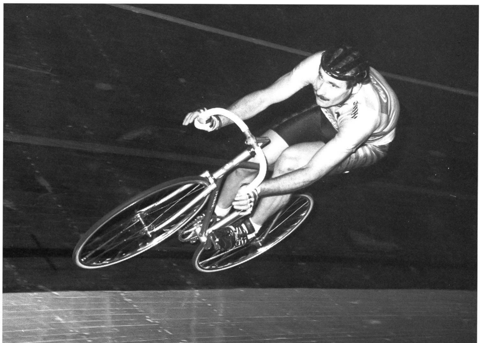
Radsportheld Urs Freuler am 6-Tage-Rennen im Hallenstadion Zürich-Oerlikon.

Der 1986 in Lausanne erstmals im Rahmen der Leiterausbildung organisierte Kurs «Fachrichtung Bahnrennsport» hat es den Teilnehmern ermöglicht, die für