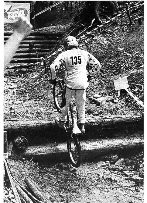
Den Umweltschützern ein Dorn im Auge: Velo-Trial.

In Gebieten mit sehr geringer Carrying Capacity, in denen die kleinste Störung bleibenden Schaden verursacht, muss somit auf eine Sportausübung verzichtet werden. Hingegen ist eine intensive Sportausübung in Gebieten mit hoher Carrying Capacity bedenkenlos verantwortbar. Der Sport hat dem Rechnung zu tragen. In verschiedenen Sportarten wie Orientierungslauf, Surfen, Variantenski fahren usw. wird dies bereits praktiziert. So werden beispielsweise Schilf- und Seerosengürtel zu Sperrzonen erklärt, Einstands- und Rückzugsgebiete von Tieren für die Sportausübung ausgeschieden. Die Einführung solcher Massnah-