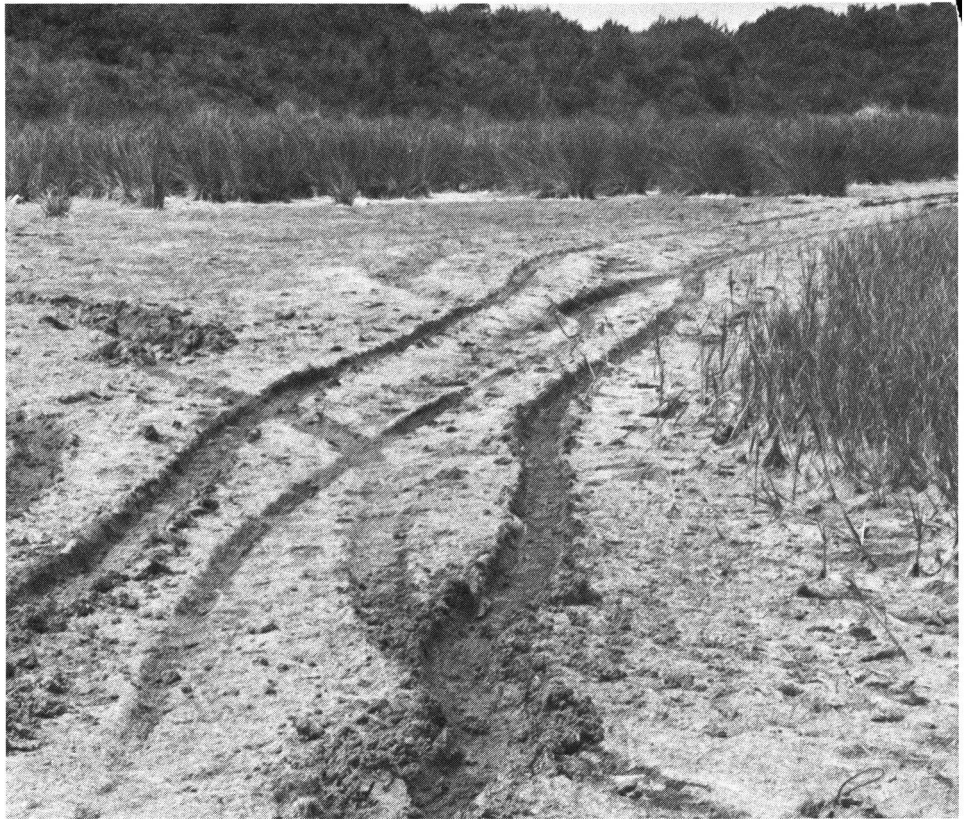
Wo der Sport seine (unwillkommenen) Spuren zurücklässt.

Die zitierten Äusserungen sollen wiederum am OL-Jäger-Konflikt erläutert werden, wobei wir unter Externalitäten nicht geldmässige Kosten sondern Einbusse an Lebensqualität verstehen wollen. Es ist verständlich, dass letzteres kaum geldmässig ausgedrückt werden kann. Die beschriebene Verhandlungslösung wird klar vom OL-Verband angestrebt. In Gesprächen wird versucht, die Forderungen der Naturschützer, Ornithologen, Jäger und Förster bei der Bahnlegung zu berücksichtigen. So werden Wildruhezonen geschaffen, Naturschutzgebiete ausgedehnt und Anpflanzungen gemieden. Solche Verhandlungen führen für alle Seiten zu befriedigenden und gangbaren Lösungen. Die Nichterfüllung der