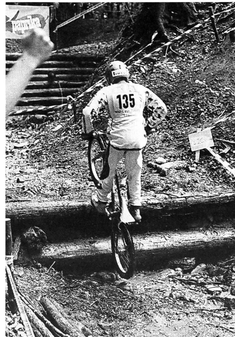
Den Umweltschützern ein Dorn im Auge: Velo-Trial.

In Gebieten mit sehr geringer Carrying Capacity, in denen die kleinste Störung bleibenden Schaden verursacht, muss somit auf eine Sportausübung verzichtet werden. Hingegen ist eine intensive Sportausübung in Gebieten mit hoher Carrying Capacity bedenkenlos verantwortbar. Der Sport hat dem Rechnung zu tragen. In verschiedenen Sportarten wie Orientierungslauf, Surfen, Variantenski fahren usw. wird dies bereits praktiziert. So werden beispielsweise Schilf- und Seerosengürtel zu Sperrzonen erklärt, Einstands- und Rückzugsgebiete von Tieren für die Sportausübung ausgeschieden. Die Einführung solcher Massnah-